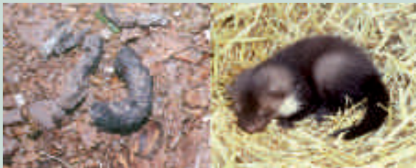
Jungmarder im Stroh