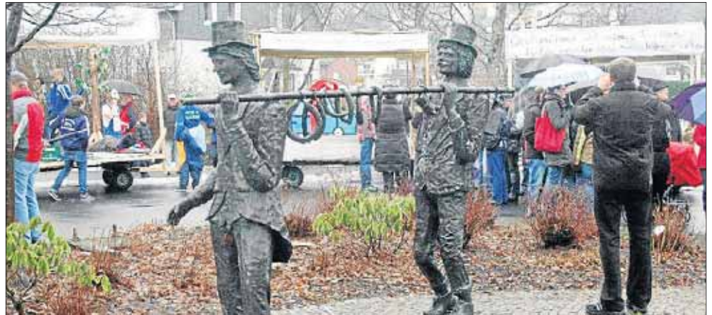
Typisch Salchendorf: Längst hat es der Brauch schon zu Denkmal-Ehren gebracht.

Schulstraße 10 57250 Netphen-Salchendorf Telefon: 0 27 37/30 93