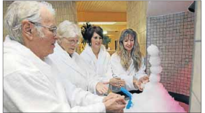
Nach dem Saunagang ist eine eiskalte Abkühlung genau das Richtige.

Wo viel Licht ist, ist auch Schatten. In der Abwägung zu den vorgenannten Vorteilen musste das Freizeitbad Netphen die Änderung der Öffnungszeiten auf morgens 10 Uhr jedoch als Nachteil in Kauf nehmen. „In der Kenntnis, dass sich dies auf die lieb gewordenen Gewohnheiten besonders einiger Stammschwimmer auswirkt, hofft das Freizeitbad Netphen jedoch, dass den frühen Schwimmern die Umstellung von zumeist nur einer Stunde nicht zu schwer fallen wird und sie sich wieder an die neuen Öffnungszeiten gewöhnen werden. Die Eintrittspreise bleiben bis voraussichtlich Februar trotz des neuen Dampfbadbereiches im Schwimmbad unverändert.“