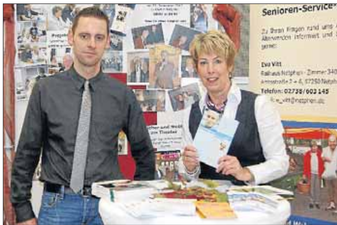
Das Veranstalterteam bot ein Riesen-Programm an.

In kompakter Form bot die Veranstaltung der älteren Generation und ihren Angehörigen Informationen und Wissenswertes zu ganz unterschiedlichen Themenkomplexen. Einen ganzen Tag lang konnten sich Senioren und ihre Angehörigen an zahlreichen Messeständen informieren, den stündlich angebotenen Fachvorträgen gespannt zuhören, an vielen Mitmach-