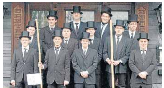
Würden Sie diesen Herren Ihre Wünsche anvertrauen?

Salchendorf. Tradition verpflichtet: Auch in diesem Jahr findet am Silvesternachmittag der traditionelle Umzug der Wurstekommission Salchendorf statt. Seit 1920 – also nun seit 90 Jahren – ziehen die Junggesellen der Burschenschaft mit ihren selbst gezimmerten Motivwagen zu Themen, die das Dorf in diesem Jahr bewegten, durch die Straßen Salchendorfs.