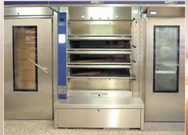
Ringrohröfen - NEU im Einsatz