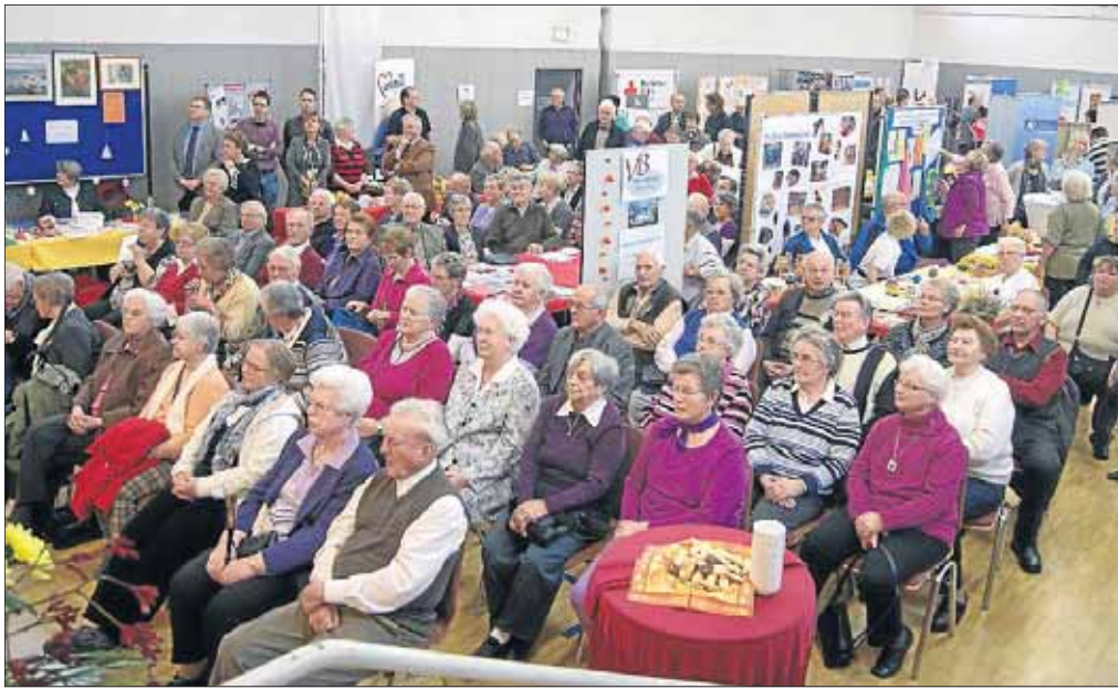
Kein Platz mehr frei: Der beste Beweis dafür, dass die Messe ihr Publikum erreichte.