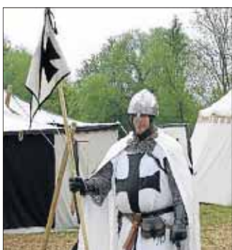
Freundliche Besucher lässt dieser Ritter gerne durch.