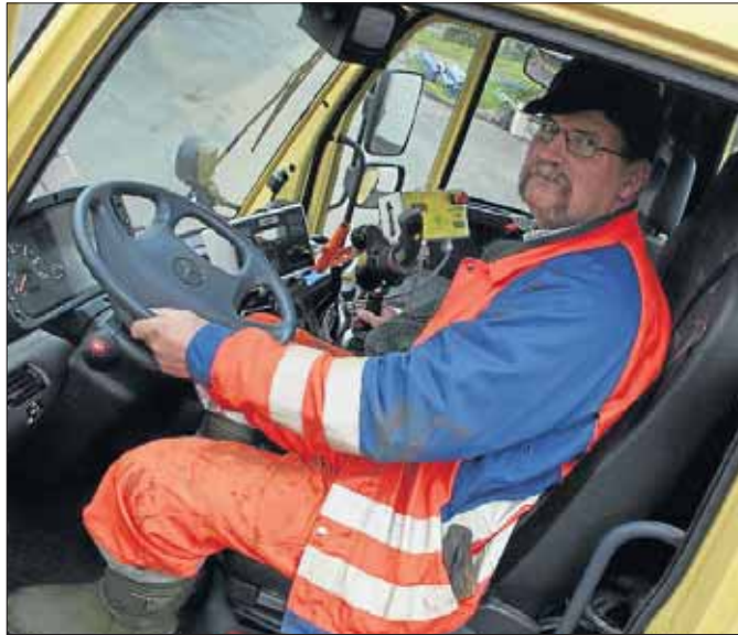
Das Cockpit eines modernen Räumfahrzeugs. Eigentlich bräuchte man drei Hände...

4.55 Uhr: Jetzt steht er oben am Steilstück der Habachstraße, 14 Prozent Gefälle. So oder so ähnlich muss sich ein Ski-