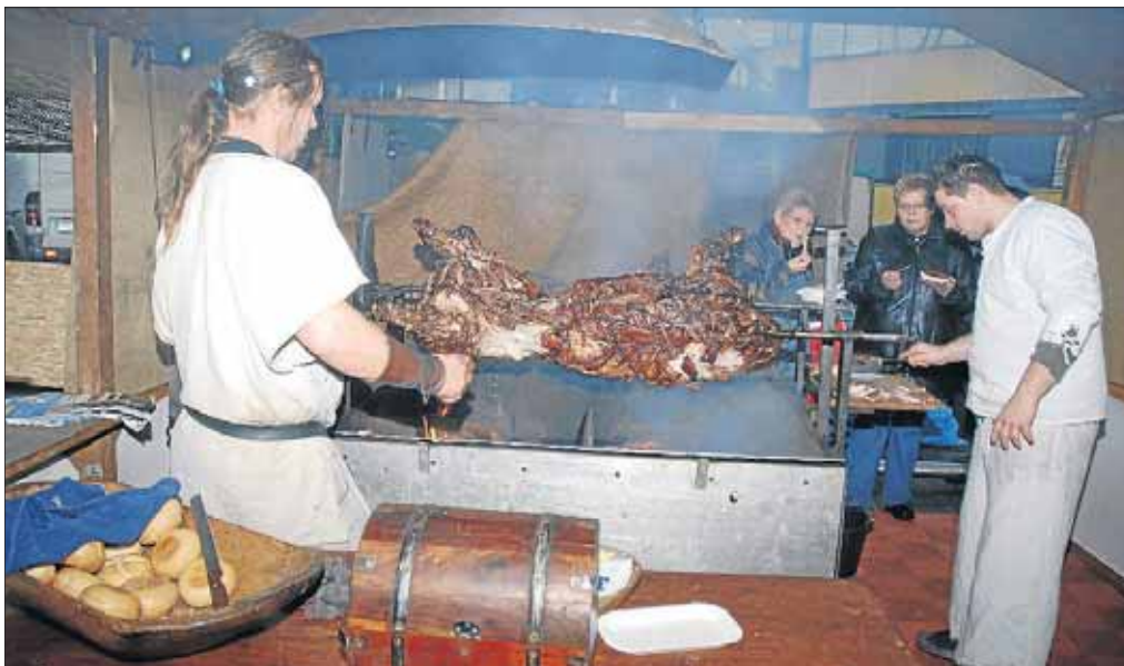
Mmmmmmm, das schmeckt. Herrliche Düfte verschiedener Speisen werden durch Netphen strömen und den Appetit anregen.