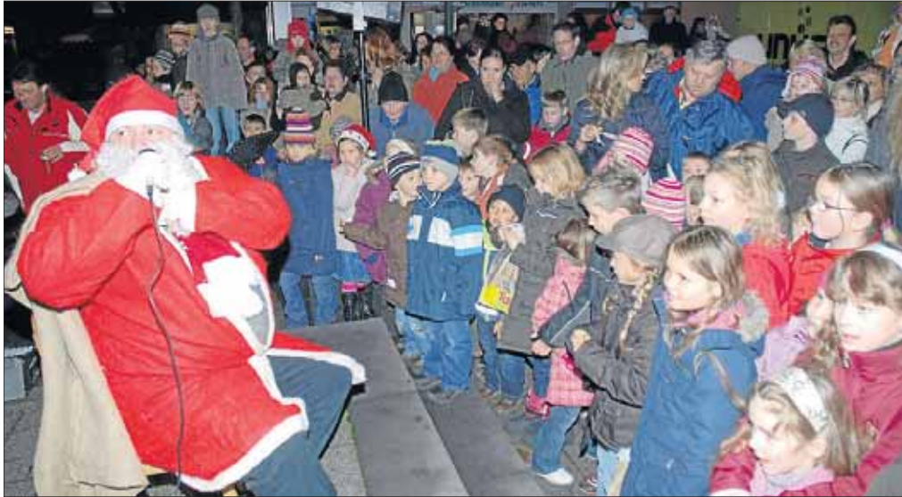
Der Nikolaus freut sich schon auf seinen Besuch in Netphen – hoffentlich haben die Kinder auch brav Gedichte und Lieder gelernt.