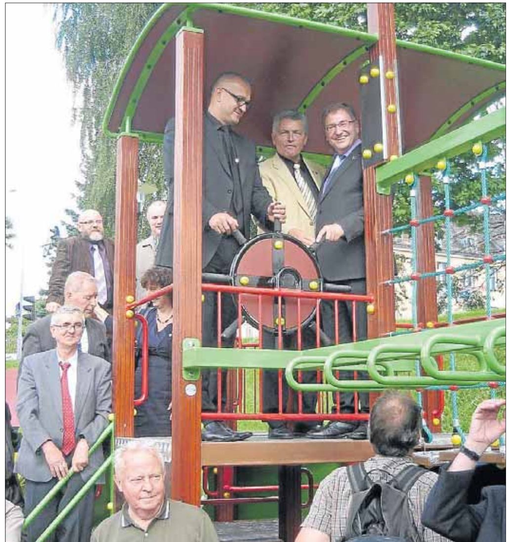
Unvergessliche Begegnungen: Viel zu entdecken gab es während der Freundschafts-Reise. Und jetzt haben die Partner ein viel besseres Bild voneinander.

Die Heimreise verlief dann ebenso problemlos wie die Hinfahrt und viele neue Eindrücke und Begegnungen wurden zu späteren Erinnerungen.