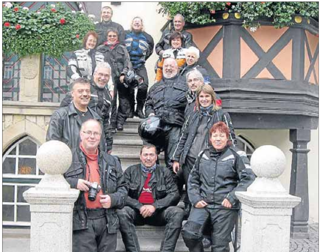
„Auf dem Bock“ durch die schönsten Gegenden Deutschlands: der MSC Eckmannshausen.

Als nächstes steht nun die Weihnachtsfeier in einem Kreuztaler Gewölbekeller auf dem Programm; aber auch die Touren 2011 sind schon fertig geplant und nun bald unter der Adresse www.msc-eckmannshausen.de einzusehen.