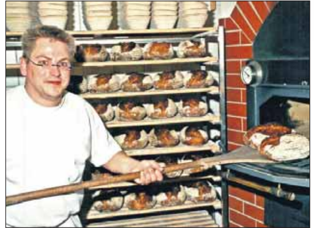
Holzofenbrote aus dem Backes

rohröfen, gepaart mit modernster Technik, hat er die Backeigenschaften, die früher für die lange Frische der Backwaren verantwortlich waren. Ein 12 Quadratmeter großer Ofen wiegt acht Tonnen. Das macht die gemauerte Thermosteifeuerung aus. Der neue Hein Stein-Dampfbackofen ersetzt den 36 Jahre alten Backofen, der 1974 beim Umbau des alten Gasthofs Wilhelm neu in Betrieb genommen wurde. Ebenfalls wurde der in die Jahre gekommene Stikkenofen (Heißluftofen) gegen einen neuen ausgetauscht. Durch die neue Ofentechnik wird ca. 30-40 % Energie eingespart was vor allem der Umwelt zu Gute kommt. Zusammen mit der im letzten Jahr durchgeführten Gebäude-Wärmedämmung befindet sich die Bäckerei Eling auf einem umweltbewussten Weg in die Zukunft.