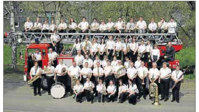
Der Musikzug Netphen sorgt am Sonntag für einen schönen Abschluss des Marktes.