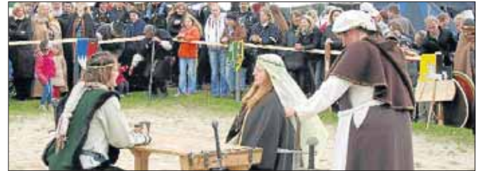
Die Rittersleut nehmen an der kleinen Tafel Platz.