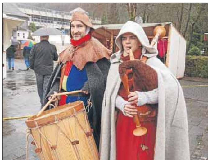
Die Rittersleut ziehen durch die Straßen.