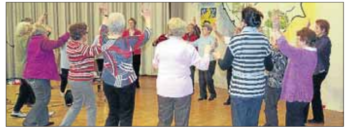
Freude und Bewegung – gemeinsam fällt beides leichter.