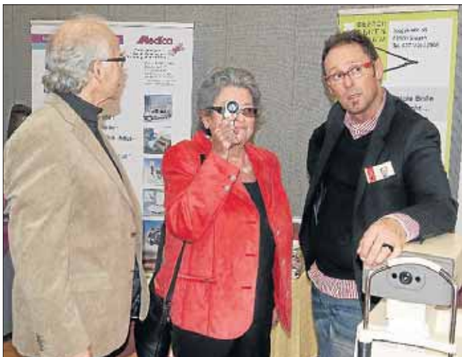
„Selbst ausprobieren“ lautete an den Ständen das Motto.

Sie empfanden den Seniorentag nicht nur als wichtige Orientierungshilfe im oft schwer überschaubaren Angebot für Menschen im Pensions- und Rentenalter, sondern auch als Ort für Begegnung und Austausch.