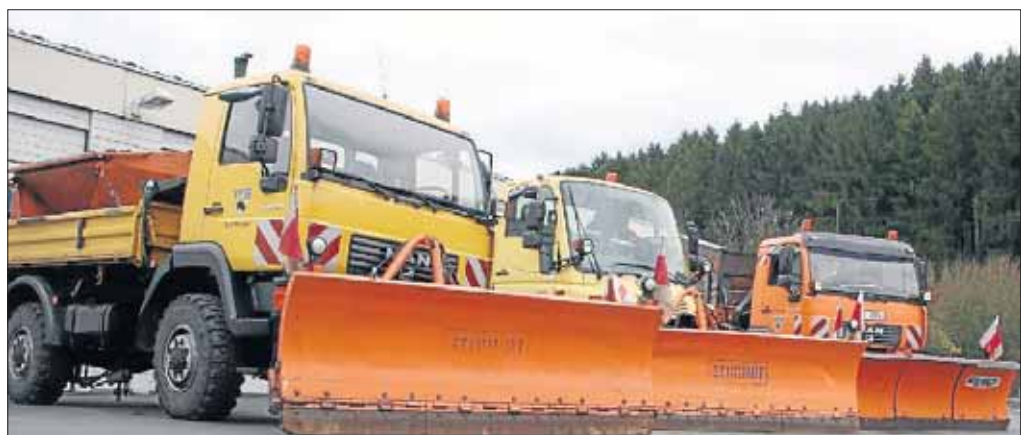
Teile der Bauhof-Flotte stehen bereit zum Einsatz.