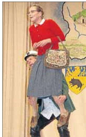
Ein bisschen Spaß muss sein.