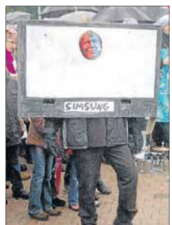
Das ist ja fast wie Karneval.

Damit nicht genug, die Wurstekommission beendet diese doch anstrengende Woche mit einem zünftigen Frühschoppen am Neujahrmorgen ab 10 Uhr, ebenfalls im Gasthof zum Johannland – bei Horbes, an dem dann nur die männliche Bevölkerung geladen ist. Wer sich also dieses traditionelle Treiben der Wurstekommission Salchendorf nicht entgehen lassen möchte, der sollte zu Beginn des Silvesterumzuges am Freitag, 31. Dezember, ab 13 Uhr in Salchendorf sein, um dieses sehenswerte Ereignis nicht zu verpassen. Weitere Informationen über die Wurstekommission als auch deren Aktivitäten findet man auch im Internet unter www.wurstekommission.de .