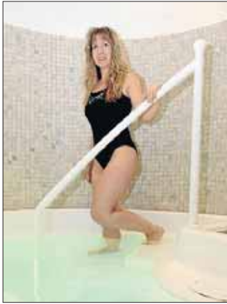
Abtauchen und den Alltag vergessen...

Die finnische Blockbohlensauna mit Panoramafenster, durch das man den Blick in die Natur schweifen lassen kann, die BIO-Sauna als Sauna der Sinne mit der Möglichkeit Licht-, Klang- und Duftvariationen zu genießen und die Landhaussauna mit rustikalem Charme bieten jedem Saunagänger das richtige Ambiente zum Wohlfühlen. Ergänzt werden die Saunen durch ein Dampfbad. Nach