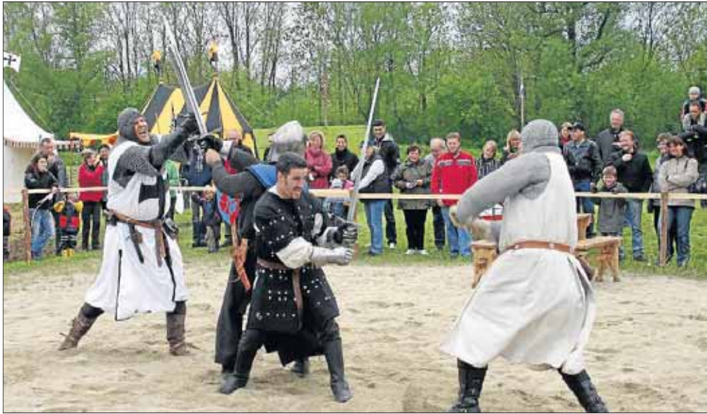
Die Ritterschaft „Vereinigtes Teutsches Lager“ führt am Weihnachtsmarkt in Netphen spektakuläre Schaukämpfe auf.