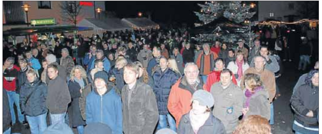
Der Weihnachtsmarkt hat sich zu einem beliebten Treffpunkt entwickelt.