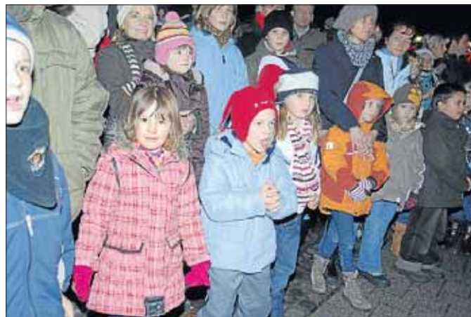
Auch für die kleinen Besucher wird in Netphen viel geboten.