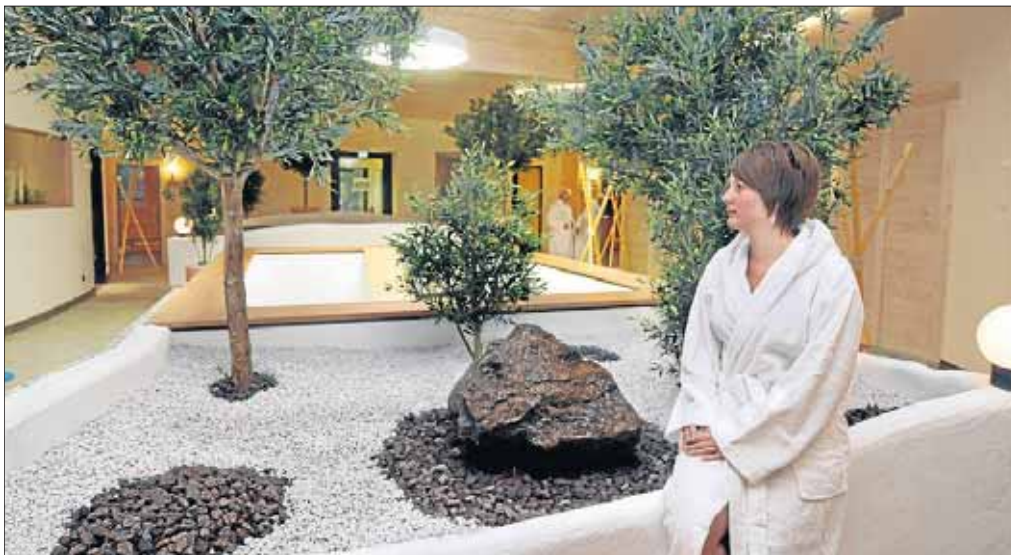
Entspannung pur: Die neue Saunalandschaft im Freizeitbad Netphen ist eine tolle Wellness-Oase.