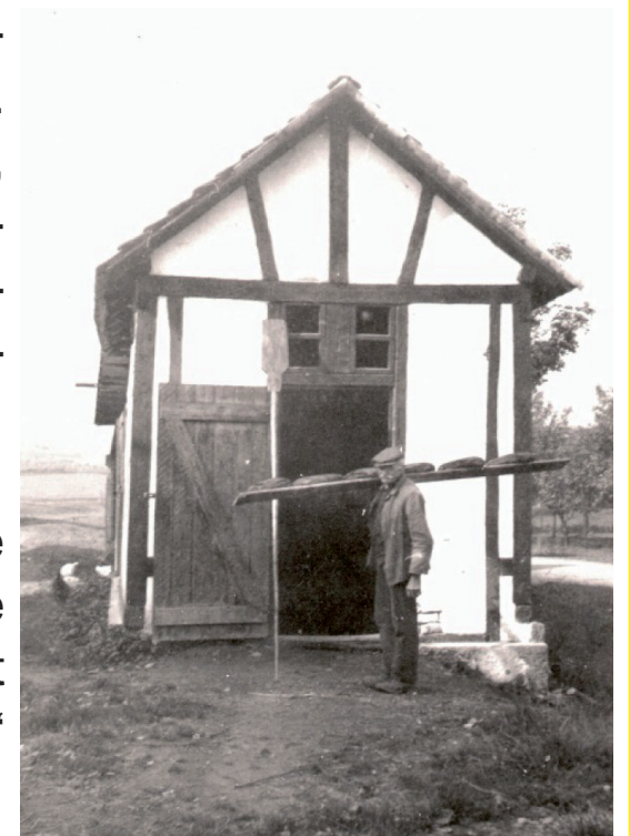
Der „Backes“ um 1930

Heute ist der „Backes“ nicht mehr in Betrieb, ist aber immer noch ein Wahrzeichen des Ortsteiles Oelgershausen.