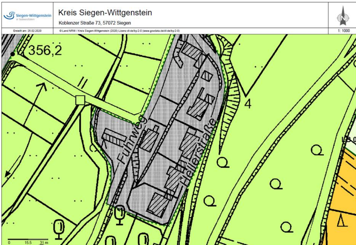
Abbildung: Auszug aus dem Entwurf zur Neuaufstellung des Landschaftsplanes Netphen

Inanspruchnahme außerhalb des Geltungsbereiches des Planes. Der Kreistag hat am 13.12.2019 diesen Landschaftsplan als Satzung beschlossen.