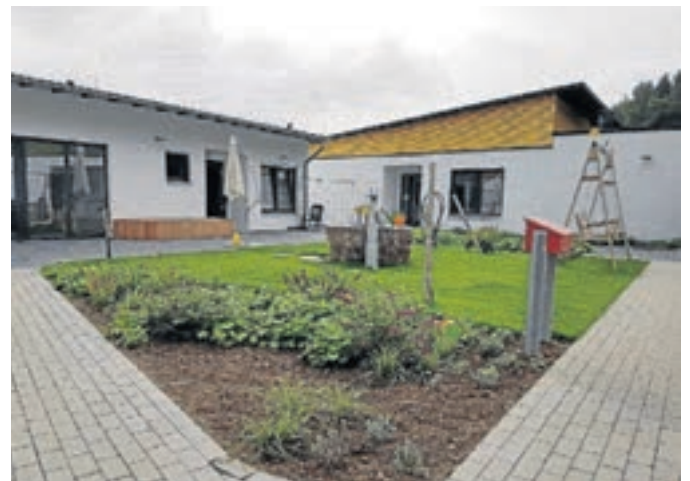
Blick in den Sinnesgarten.

Ein Bewohnerplatz werde durch die zuständige Sozialbehörde finanziert, und zwar auf ein Mindestmaß reduziert. Alles, was das Projekt einzigartig mache, sei durch Spenden finanziert. „Was aber ebenso gebraucht wird sind Menschen, die das Projekt mit ihrer Arbeitskraft unterstützen wollen.“