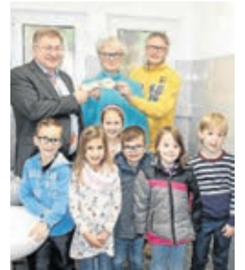
Bei der „Schlüsselübergabe“.

Kostenrahmen in Höhe von 50.000 Euro konnte weitestgehend eingehalten werden. Die Stadt bedankt sich für die Rücksichtnahme während der Bauphase bei der Schulleitung, dem Kollegium, allen Grundschulern und Betreuungskräften. Außerdem wurde die Grundschule Dreis-Tiefenbach mit 16 Tablets ausgestattet. Nach und nach sollen auch die weiteren Grundschulen so ausgerüstet werden.