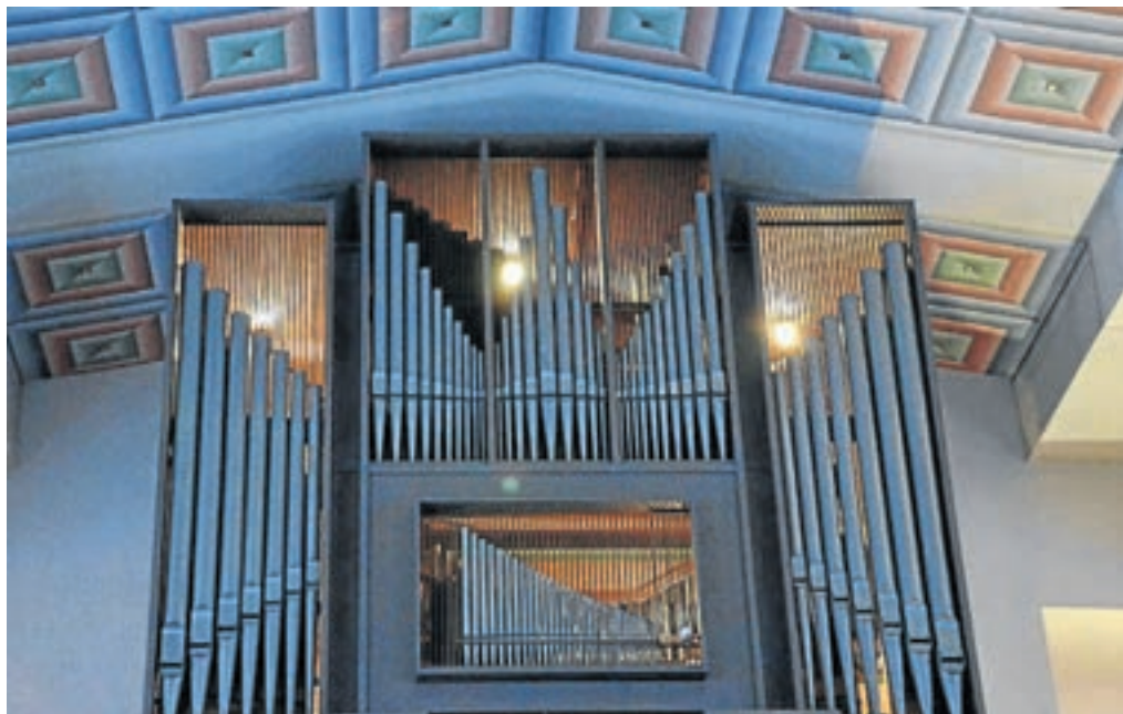
Licht- und Schatteneffekte wurden 1995 in Lasurtechnik in Orange, Blau und Grün aufgetragen, die Quadrate und Rechtecke in Blattgold ausgefüllt.