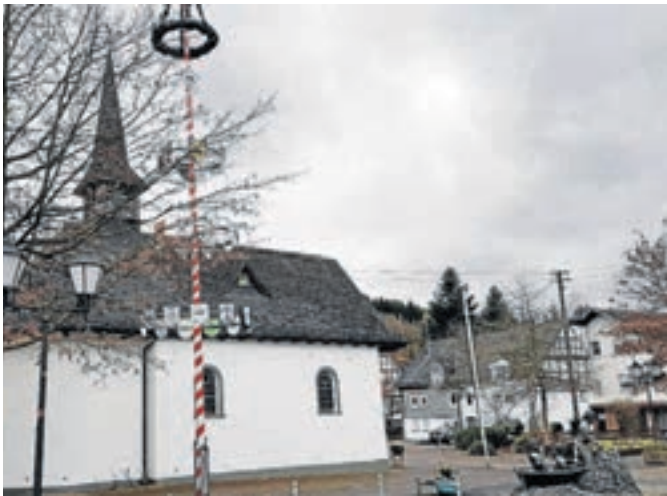
In diesem Jahr wird auf dem Petersplatz wieder ein Maibaum prangen.

Damit der 1. Mai von allen Bürgern mit unterschiedlichen Zielen wandermäßig genossen werden kann, hoffen die Gastgeber auf nichts als puren Sonnenschein.