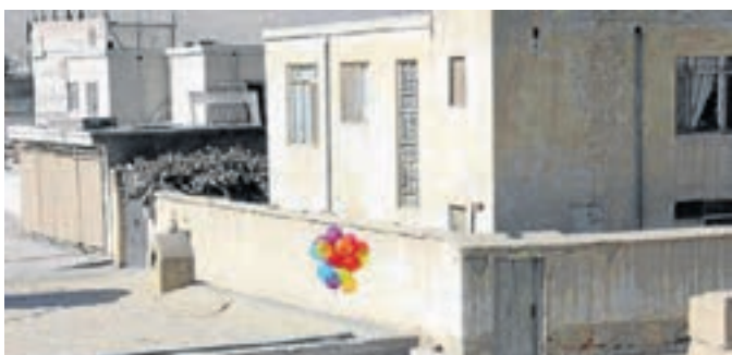
Zohra Soori-Nurzad gewährt einen „Fotografischen Blick in Kabul/Afghanistan“.

stellung von Zohra Soori-Nurzad „Fotografischer Blick in Kabul/Afghanistan“. Sie schreibt: „Mein künstlerischer Ansatz wird beeinflusst durch meine Lebenserfahrung in Afghanistan wie auch durch meine westliche Sozialisation. Durch dieses Spannungsfeld wird mein Leben und meine Arbeit geformt und gefördert. Meine künstlerische Arbeit sehe ich als Medium zur Interpretation und Kommentierung sozialpolitischer Realität, wie sie sich für mich sowohl in Afghanistan als auch im Westen darstellt. Im Speziellen interessiert und beschäftigt mich die reale sozialpolitische und kulturelle Situation der Frauen und Kinder in Afghanistan in Vergangenheit und Gegenwart. Seit sechs Jahren beschäftige ich mich mit Fotografien und Videos aus Afghanistan und reise einmal in das Land, um dort zu recherchieren und um meine Aufnahmen machen zu können. Mein künstlerischer Ansatz und die Ziele meiner Arbeit sind einerseits durch meine besondere persönliche Erfahrungswelt, andererseits durch die vorgegebene ‚westliche‘ Medienauswahl geprägt. Ich bin in der afghanischen Kultur geboren, dort schon sehr jung dadurch stark geprägt, aber in Deutschland aufgewachsen und auch durch das Leben hier geformt. Daher sehe ich viele Dinge sowohl durch den ‚westlichen‘ wie durch den ‚afghanischen‘ Blick. Mit Hilfe der künstlerischen Fotografie- und Videoarbeit versuche ich die beiden Kulturen zu interpretieren und zu kommentieren.“ Der Eintritt ist frei.