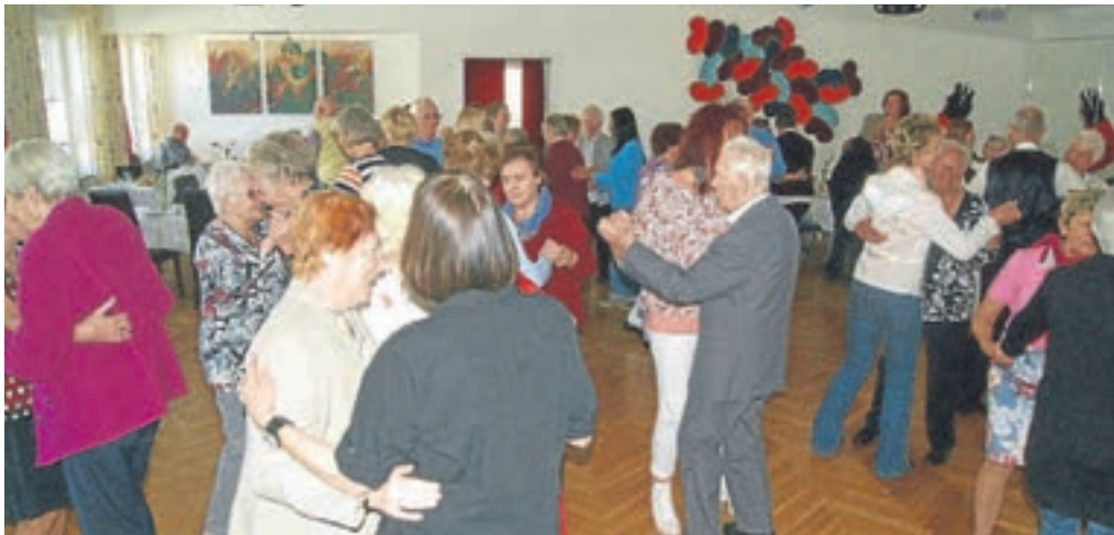
Es geht nicht um tänzerische Höchstleistungen, sondern darum, sich gemeinsam an Schönes zu erinnern.