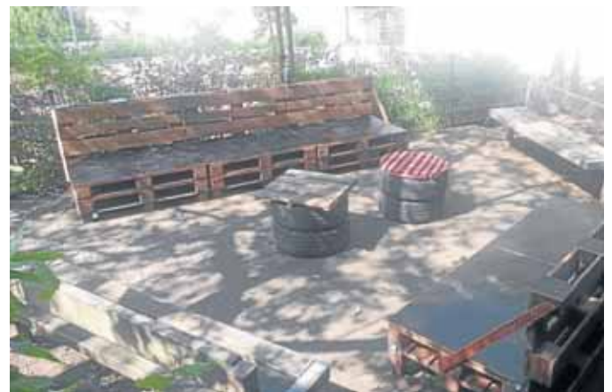
Mit Paletten wurde der neue Außenbereich für den Jahrgang 10 gestaltet.

Das Leitbild der Schule ist „Gemeinsam.Aankommen“ – man könnte aber auch sagen „Gemeinsam anpacken“,