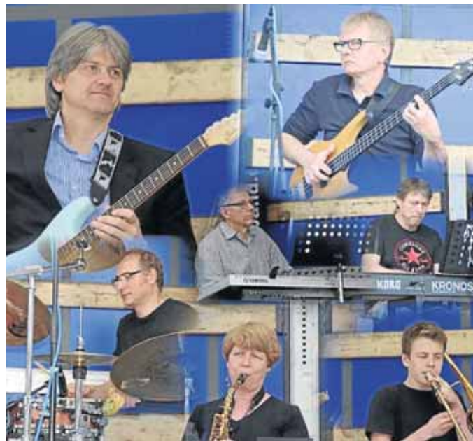
„Solar Plexus“ ist am 8. Dezember zu Gast im Alten Feuerwehrhaus in Netphen.