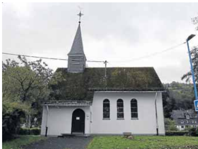
Auch an der Modernisierung der ev. Johanneskapelle im rund 420-Seelen-Ort wirkte Willi Schöler tatkräftig mit.

Sie sind selbst im Verein, Verband oder bei einer Institution aktiv?