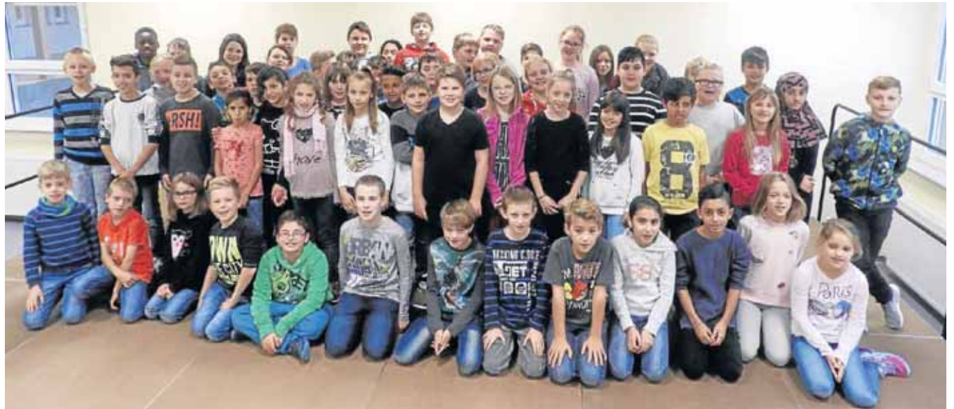
Die neuen Schülerinnen und Schüler. Mit den neuen 5ern ist die Sekundarschule Netphen voll aufgebaut.

„Fertig!“ – Das bedeutet, alle Jahrgangsstufen 5 bis 10 sind nun besetzt. Die dreizügige Schule ist gut aufgestellt und mittlerweile besuchen etwa 480 Schülerinnen und Schüler die Sekundarschule in Netphen. Auch das Kollegium ist angewachsen, 50 Lehrerinnen und Lehrer gehören ebenso zur Schulgemeinschaft wie Lehramtsanwärter und Sonderpädagogen, die Sozialpädagogin, die Schulsekretärin und der Hausmeister. Und zuletzt: Für das lau-