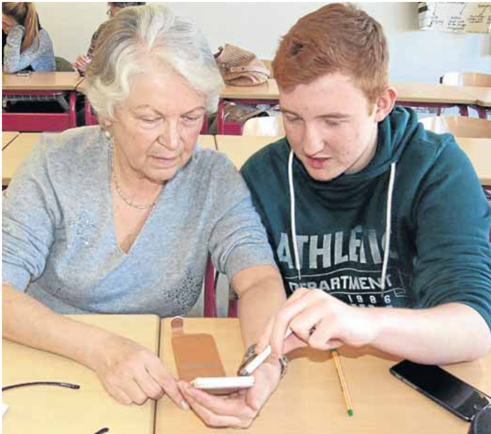
Der Umgang mit Smartphones ist für Jugendliche selbstverständlich. So können sie älteren Menschen leicht Tipps und Ratschläge geben.