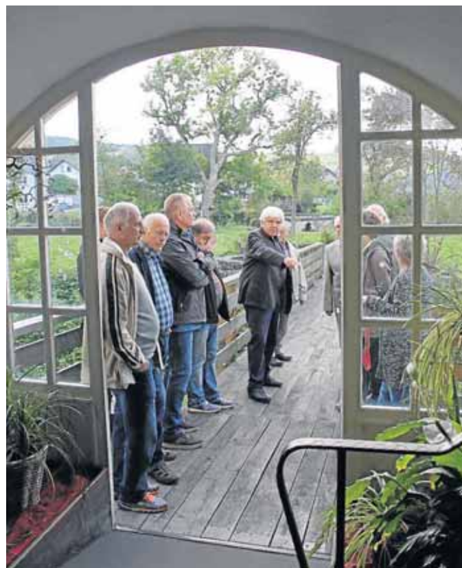
Die Bürger diskutierten vor Ort über mögliche Neugestaltungsmaßnahmen.

i IKEK bedeutet „integriertes kommunales Entwicklungskonzept“. Dieses Konzept bildet die Fördergrundlage für Projekte, die im Rahmen der ländlichen Entwicklung gefördert und umgesetzt werden sollen.