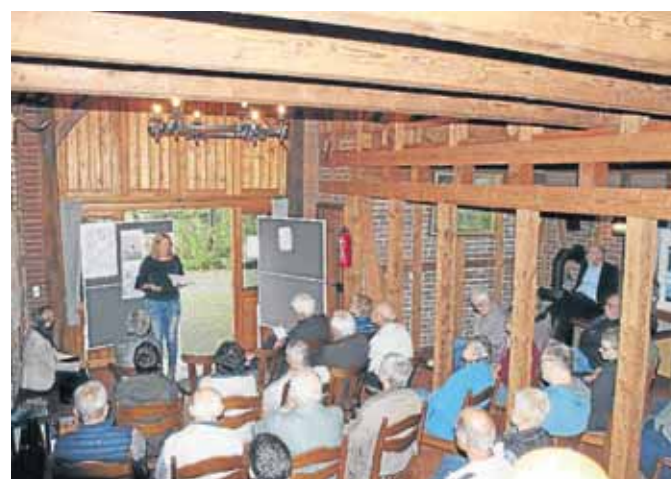
Bei einer Bürgerveranstaltung in der Burgremise wurden Anregungen von Bürgern aufgegriffen.