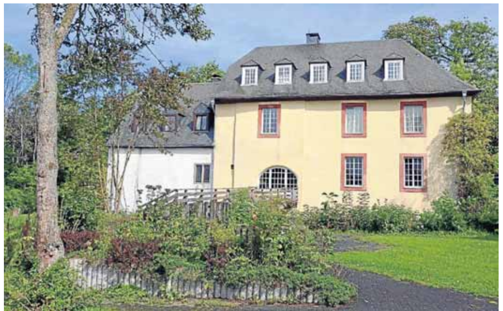
Neues Leben soll in die Wasserburg Hainchen einziehen.

• Parklandschaft: Noch in diesem Jahr soll die Förderantragstellung bei der Bezirksregierung erfolgen. Der Auftakt zum Planungsprozess ist mit der ersten Ideenwerkstatt ge-