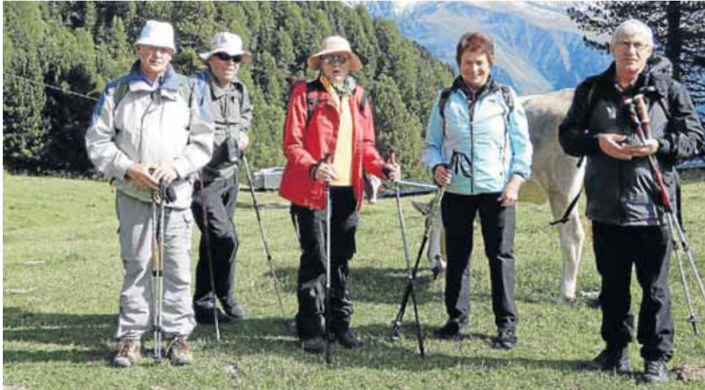
Abwechslungsreiche Touren erlebte die SGV-Gruppe aus Deuz.