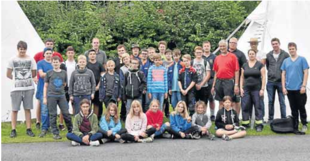
Viel Spaß hatten die Jugendlichen beim Landeszeltlager der Jugendfeuerwehr NRW.

Netphen. Einige Mitglieder der Stadtjugendfeuerwehr Netphen haben am Landeszeltlager der Jugendfeuerwehr Nordrhein-Westfalen teilgenommen. Das Zeltlager fand bei bestem Wetter im Campingpark am Hennesee in Meschede statt.