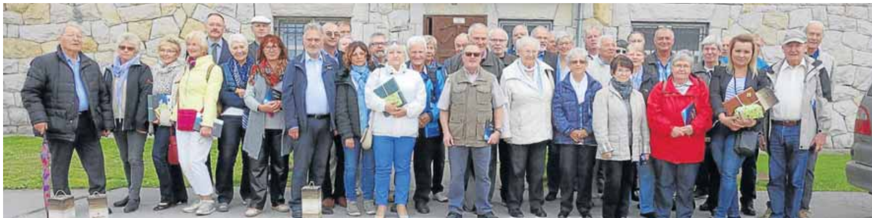
Der Verein für Städtepartnerschaft Netphen hat erneut eine Reise nach Zagan organisiert.