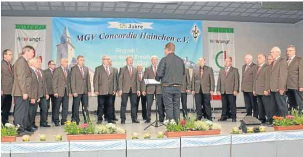
Auf sein 125-jähriges Bestehen zurückblicken konnte mit einem dreitägigen Fest der MGV „Concordia“ Hainchen.