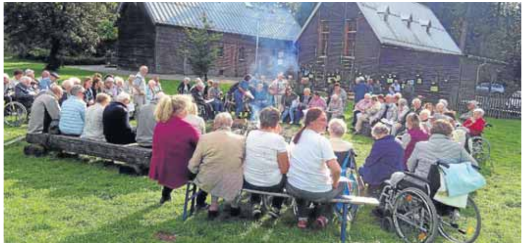
Rund 80 Menschen waren der Einladung der Seniorenbeauftragten und der Stadt gefolgt.

Weitere Informationen über das IKEK mit den Projektideen und den Ortsteilprofilen erhalten Interessierte auf der Homepage der Stadt Netphen unter www.netphen.de/IKEK .