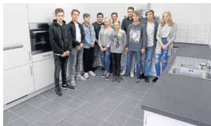
Die Schülervertretung ist stolz: Bald startet der Schulkiosk den Verkauf.

„Fertig!“ ist die Sekundarschule also noch nicht, es gibt noch einige Ideen und Wünsche, die Schüler wie Lehrer haben. Wer mehr über die Sekundarschule Netphen erfahren möchte, kann die Homepage besuchen: www.sekundarschule-netphen.de .