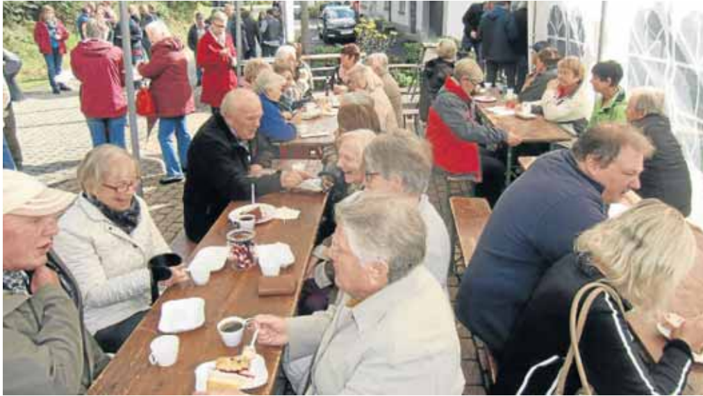
Die Backesfestbesucher ließen es sich in Grissenbach gut schmecken.