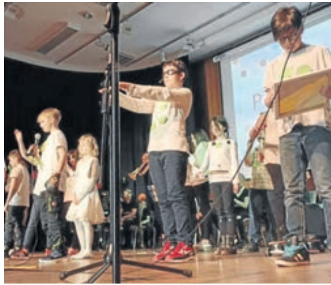
Der Religionskurs der Klasse 9 setzte sich mit der Klasse 6 zusammen und entwickelten das gemeinsame Theaterstück „Punktinello – Jedes Kind ist besonders“.

des. Unter der Leitung von Musiklehrer Florian Schnurr boten die Schüler ein breites Repertoire an, von „Play that funky music“ über „Freddie Freeloader“, „Seven Nation Army“ bis hin zu „Qye como va“. Das Publikum klatschte begeistert mit. Und berechtigterweise spielte die Band kurz vor Schluss „Ein Hoch auf uns“. „Es sind wirklich alle Fächer involviert“, staunten einige Eltern. So zeigten die 5er-Klassen kleine Theaterstücke. Dabei legte die 5a den Fokus darauf, was das Leitbild der Schule „Gemeinsam. Ankommen.“ für sie bedeutet. Die 5c baute viele Begriffe und Redewendungen zu dem Wort „Punkt“ in ihre ebenfalls selbstgeschriebenen Stücke ein. Der Jahrgang 7 näherte sich im Deutschunterricht mit Balladen dem Kulturwochen-thema an. Die 7b stellte die von ihnen vorgetragene Ballade „Die Heinzelmännchen“ live in Standbildern auf der Bühne dar, die 7a spielte ihre gelungene Vertonung von John Maynard vor. Weitere Ergebnisse wurden in einer Ausstellung zu den Kulturwochen veröffentlicht. Die 7c zeigte in einer sportlichen Performance mit einem Augenzwinkern ihre Vorstellungen zu dem Thema Punkte: Sie nahmen die oft im Fernse-