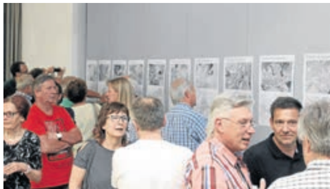
Während des IKEK-Forums konnten sich Interessierte über die abgegrenzten Fördergebiete ihres Ortes informieren.