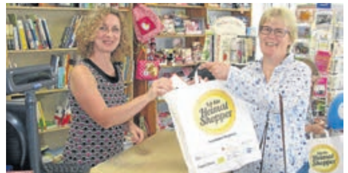
Die IHK Siegen wird auch im Jahr 2017 an der Imagekampagne „Heimat shoppen“ teilnehmen.

„Heimat shoppen“ soll eine langfristig angelegte Werbemaßnahme sein, um die wichtige Rolle der lokalen Händler, Dienstleister und Gastronomen für eine attraktive und lebendige Innenstadt darzustellen. Die Kampagne wird in diesem Jahr an den beiden Aktionstagen 8. und 9. September durchgeführt werden. Interesse geweckt? Dann