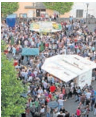
Viele Musik-Fans zieht es freitags nach Netphen.

Netphen. Die Veranstalter Netphen Events und Kulturforum Netphen freuen sich, zum zehnten Mal die beliebte Veranstaltungsreihe „Freitags in Netphen“ auf dem Rathausplatz in Netphen anbieten zu können.