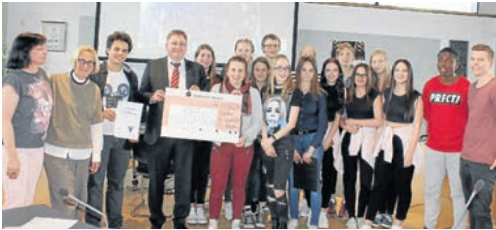
Der Erlös des Afrikaprojekts kommt der Root Foundation in Ruanda zugute. Die Mädchen und Jungen aus Kigali waren via Skype zugeschaltet.