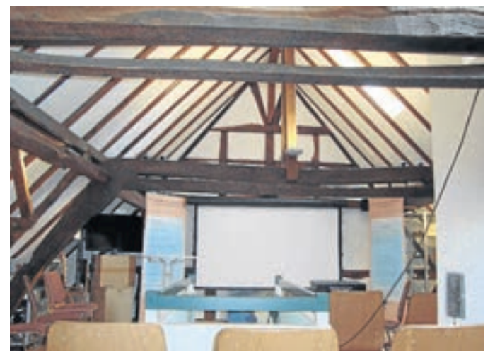
Das Dachgeschoss im Heimatzentrum „Haus Pithan“ in Dreis-Tiefenbach wurde für Vortragsveranstaltungen ausgebaut.

Die Fläche unter den Dachschrägen wurde jedoch ausgenutzt zur Präsentation von Gerätschaften und Exponaten, die einen Einblick in Landwirtschaft, Handwerkschaft und Hauswirtschaft früherer Zeiten sowie in die Dorfgeschichte geben. So ist etwa ein Teil des Stammes der über 500 Jahre alten Dorflinde zu sehen, die vor einigen Jahrzehnten dem Straßenverkehr zum Opfer fiel, oder auch eine Ofenplatte von 1782, die bei der historischen Mühle entdeckt wurde. Mit der Fertigstellung des Dachgeschosses wurden so auch die bereits vorhandenen Ausstellungen im Haus Pithan vervollständigt. Im Erdgeschoss ist mit der im Siegerland einzigartigen Präsentation „Vom Wind-