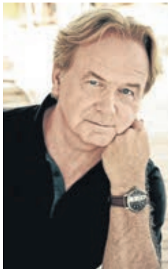
Klaus Hoffmann kommt zu einer musikalischen Lesung nach Netphen.

Netphen. Er ist einer der bekanntesten und beliebtesten deutschen Liedermacher und Schauspieler: Klaus Hoffmann kommt am Samstag, 24. Juni, um 19 Uhr in die Aula des Gymnasiums Netphen – präsentiert vom Kulturforum Netphen. Im Gepäck hat er seine Biografie „Als wenn es gar nichts wär – Aus meinem Leben“.