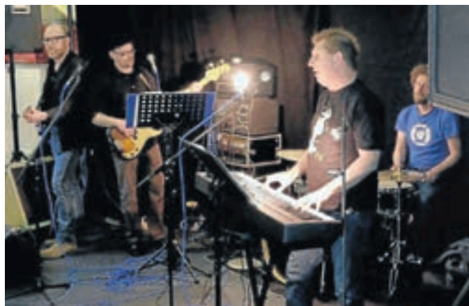
Die Dozenten des Workshops sind Lehrer der Musikschule und Mitglieder der Lehrerbänd.