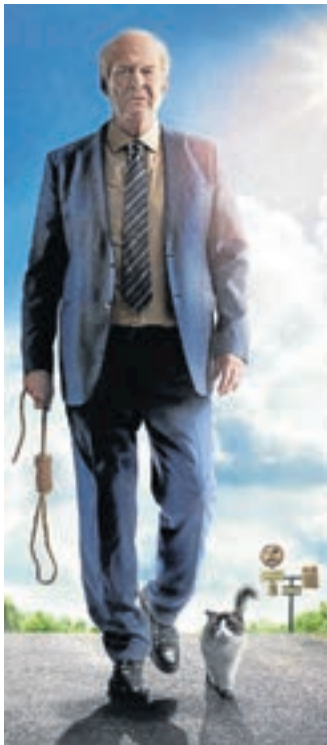
Hinter der grimmigen Fassade von Ove (Rolf Lassgård) verbirgt sich ein großes Herz.

Dahlbruch/Netphen. Die erfolgreiche Seniorensfilmreihe „ohne ALTERSbeschränkung“ endet in diesem Jahr am 7. November mit der schwedischen Literaturverfilmung „Ein Mann namens Ove“.