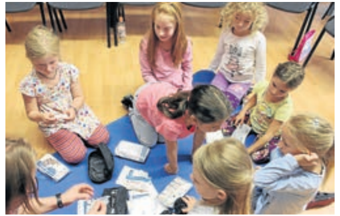
Mit viel Begeisterung übten die Kinder das richtige Verhalten in einer Notsituation.

Lahnhof 1 · 57250 Netphen-Lahnhof Tel. (02737) 241 · Fax (02737) 243