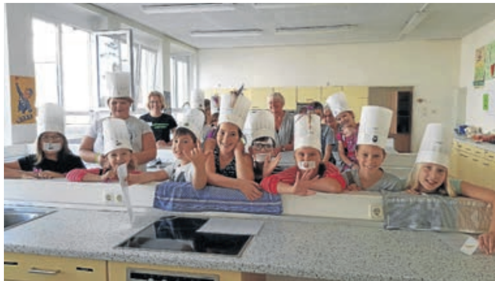
Die Kinder waren mit vollem Eifer dabei. Mit eigenen Kochmützen ging es ans Schneiden, Backen, Rühren und Kochen.

Wir rechnen daher fest mit ihrem wohlüberlegten und verantwortungsbewussten Handeln in unserer gemeinsamen Sache.“