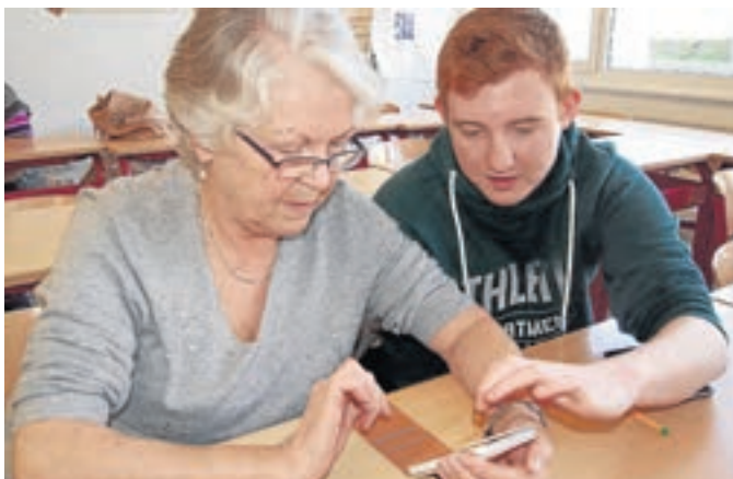
Bilden ein gutes Team: Seniorenschülerin und Lehrerschüler beim Projekt „Neuland“.

Netphen. Das Gymnasium Netphen hat zusammen mit der Senioren-Service-Stelle der Stadt Netphen das Projekt „Neuland“ ins Leben gerufen, das in diesem Herbst schon zum neunten Mal stattfindet. Dieses innovative Konzept sieht vor, dass die Schüler der Jahrgangsstufen 9 bis 12 nach Schulschluss in die Rolle der Lehrer schlüpfen und interessierten Senioren unter anderem Einblicke in die moderne Medienwelt bieten.