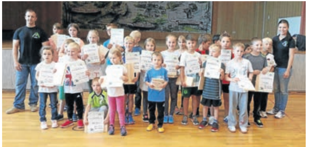
Zum Abschluss des Selbstverteidigungskurses erhielten die Kinder das von ihnen selbst durchgeschlagene Bruchbrett und eine Urkunde als Erinnerung.

Mädchen und Jungen lernten sich selbst zu verteidigen