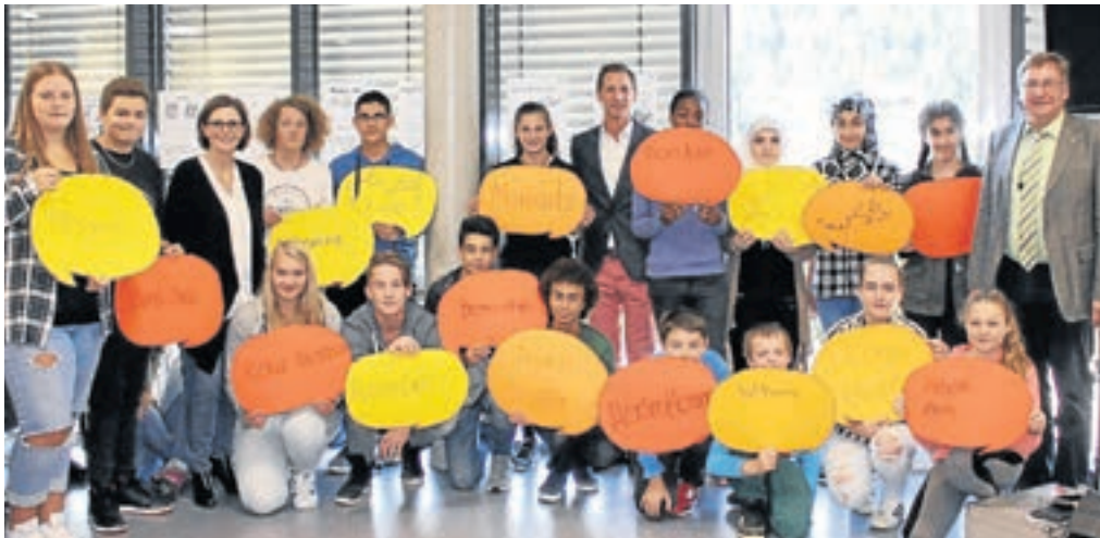
Auftakt zur Teilnahme an „Vielfalt und Zusammenhalt in Siegen-Wittgenstein“: Schüler der Sekundarschule Netphen zeigten ihre Vielfalt und grüßten die Teilnehmer in vielen verschiedenen Sprachen.