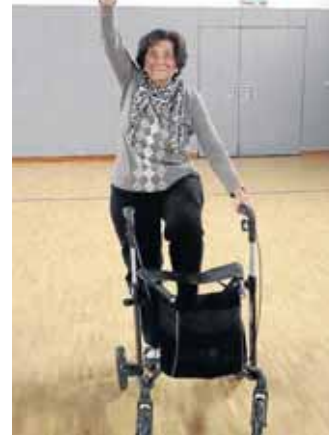
Gleichgewichtssinn und Reaktionsfähigkeit werden beim Rollatorkurs geübt.