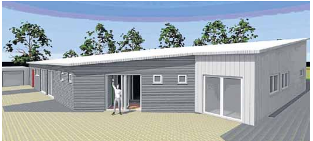
Das geplante Vereinsheim an der Sporthalle des Netphener Gymnasiums auf der Haardt wird gebaut. Die Mehrheit der Mitglieder des TVE Netphen stimmte für das Projekt.

Die Vorfreude wächst mit jedem Tag und die Jugendfeuerwehr wartet darauf, dass es endlich losgeht. Es muss nicht immer ein Ausflug in die Ferne sein. Auf dem Zeltplatz in Netphen erwarten die Teilnehmer am Zeltlager zahlreiche Mitmachaktionen und insgesamt viele Freizeitangebote. Dazu zählen natürlich Zeltlagerklassiker wie ein Fußball- oder ein Volleyballturnier, aber auch andere lustige Turniere wird es geben. Ein Ausflug an die Oberrautalsperre mit Besichtigung der Staumauer und ein Besuch beim Kohlenmeiler in Walpersdorf stehen ebenfalls auf dem Programm. Wer nach Abkühlung sucht, findet diese im nahe gelegenen Warmwasserfreibad Netphen. Aber auch Angebote wie Minigolf und Indoor-Soccer locken in den nahegelegenen Sport- und Freizeitpark Netphen.