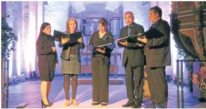
Das Kammer-Ensemble „Con Anima Musica“ aus der Partnerstadt Zagan sang im bunt ausgeleuchteten Kirchenschiff von Alt St. Martini.