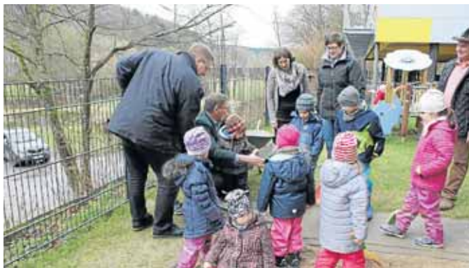
Das Familienzentrum Rabennest in Deuz wird erweitert, damit dort 81 Kinder Platz finden.