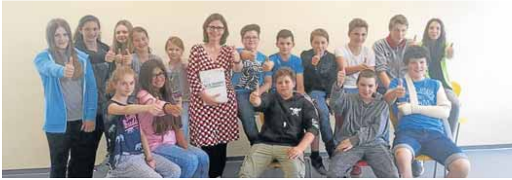
Daumen hoch: Die Sekundarschule Netphen ist mit dem Ergebnis der Qualitätsanalyse (QA) sehr zufrieden.

„Wer hohe Türme bauen will, muss lange am Fundament verweilen.“ Dieses Zitat des Komponisten Anton Bruckner hat Andreas Kremer, Qualitätsprüfer bei der Bezirksregierung Arnsberg, aus dem Schulprogramm der Sekundarschule Netphen genommen, um eine Bilanz aus den Besuchstagen während der Qualitätsanalyse (kurz: QA) an der Sekundarschule Netphen zu ziehen.