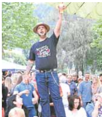
Live-Musik gibt es auch diesmal bei „Freitags in Netphen.“