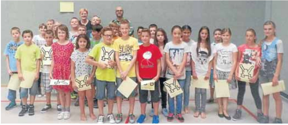
Die neue Klasse 5c freute sich auf ihren ersten Unterrichtstag in der Sekundarschule.