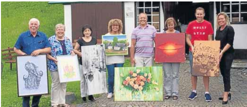
Sieben Künstler des Künstlerkreises Oberes Siegtal stellten ihre Werke in der Wassermühle in Netphener Nachrichten aus.