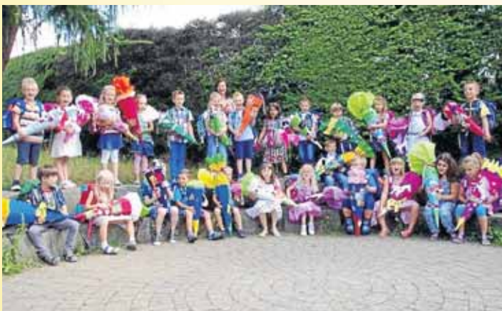
Die knallbunten Schultüten durften bei den neuen Grundschulern in Deuz nicht fehlen.