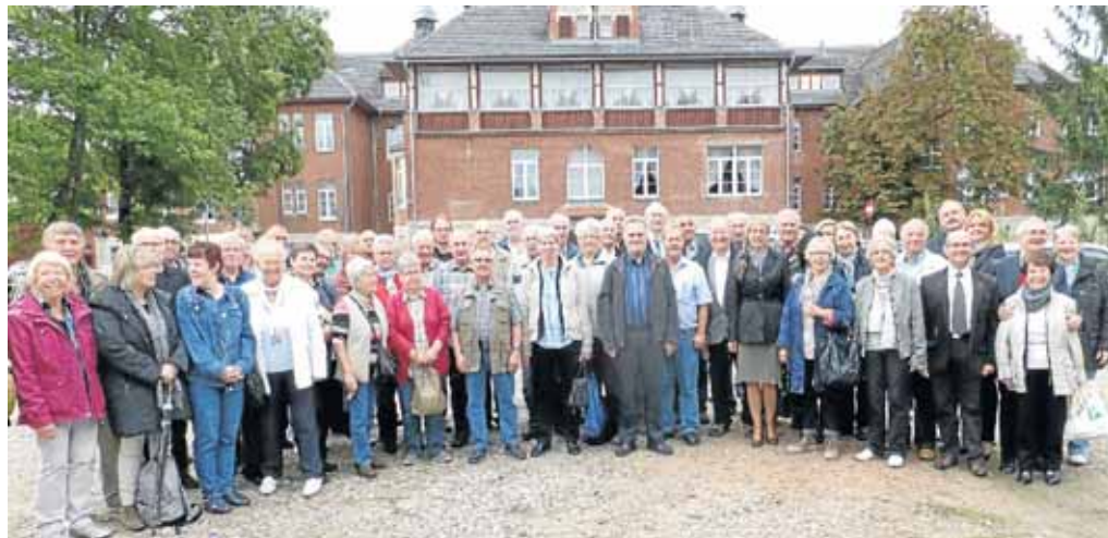
Die Delegation aus Netphen besuchte die Partnerstadt Zagan. Die Partnerschaft der beiden Städte besteht bereits seit 20 Jahren.