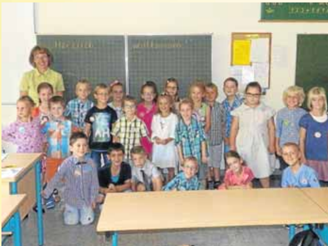
Die neuen Erstklässler wurden in der Grundschule Eckmannshausen willkommen geheißen.