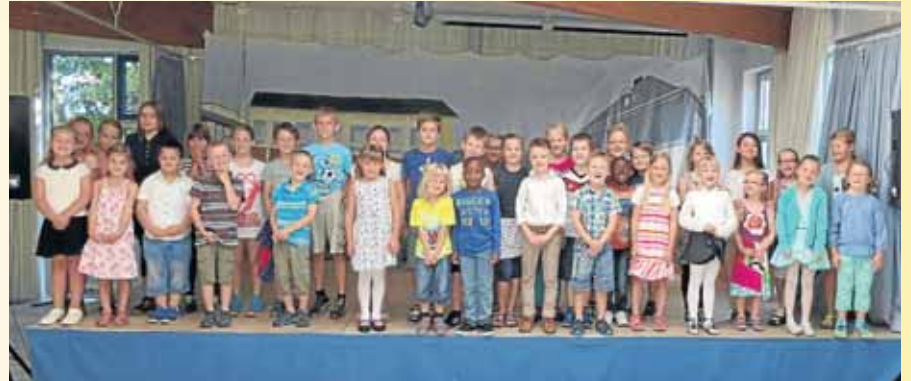
Die Grundschule in Dreis-Tiefenbach startete mit zwei Klassen ins erste Schuljahr. Die Klasse 1a konnte den Schulstart kaum erwarten.