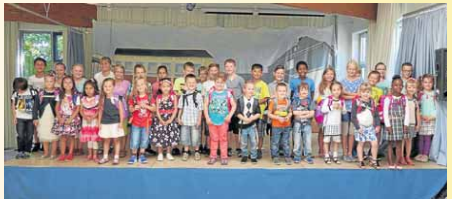
Die Klasse 1b der Grundschule Dreis-Tiefenbach war ebenfalls ganz gespannt auf den ersten Schultag.