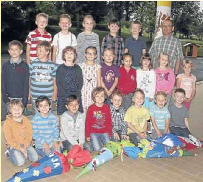
Auf ihren ersten Schultag freuten sich die „i-Männchen“ der Grundschule Hainchen.