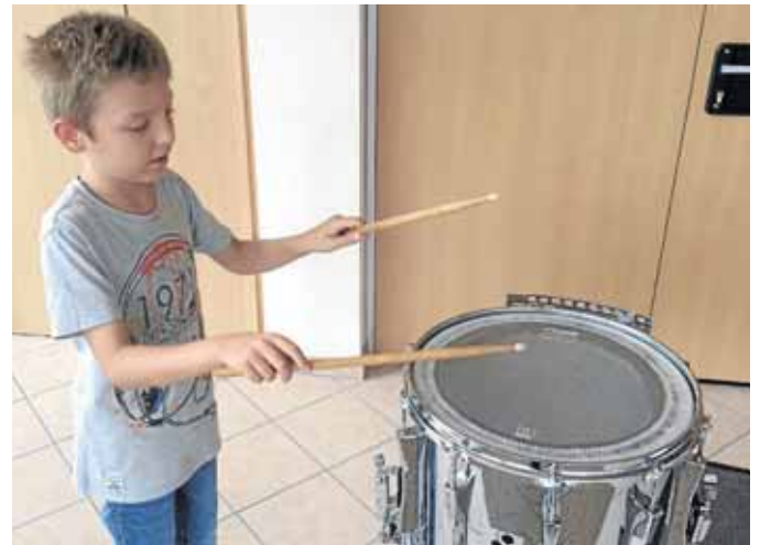
Der Schnuppertag der Musikkapelle Irmgarteichen war für so manchen vielleicht der Beginn einer großen Karriere, zum Beispiel als „Drummer“.