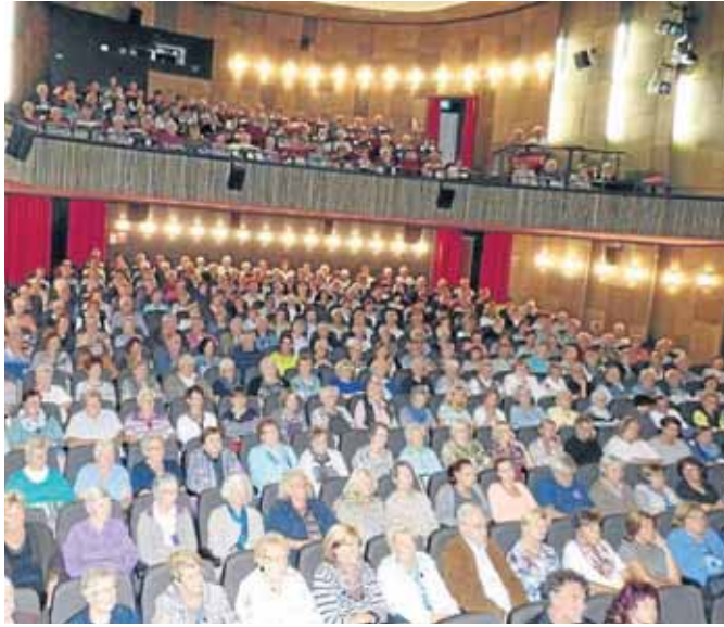
Der Kinosaal war bei „Honig im Kopf“, gezeigt in der Reihe „Ohne Altersbeschränkung, gut besucht.

Dahlbruch/Netphen. Die Saison der Spielzeit 2015 des gut besuchten Programmhighlights für Senioren „Ohne Altersbeschränkung“ im Viktoria-Kino in Dahlbruch neigt sich dem krönenden Abschluss zu. Einmal im Monat, jeweils an einem Montag, lief ein aktueller Film des abwechslungsreichen Programmes, das speziell für ältere Mitbürger ausgewählt wurde. Seit 2015 unterstützt erstmals auch die Stadt Netphen seitens der Senioren-Service-Stelle das Projekt.