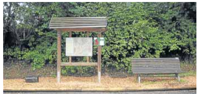
Auf dem neugestalteten Parkplatz Leimbachtal darf die Wandertafel nicht fehlen.

Ab sofort ist der Parkplatz für Wanderfreunde, Hundebesitzer und Naturliebhaber nutzbar. Ende Oktober ist auch die Bepflanzung mit Wiesenflächen und Obstbäumen fertig gestellt. Sitzmöglichkeiten und Tische laden zum Verweilen ein. Außerdem