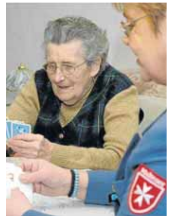
Beim Besuch der Helfer wird zum Beispiel Karten gespielt.