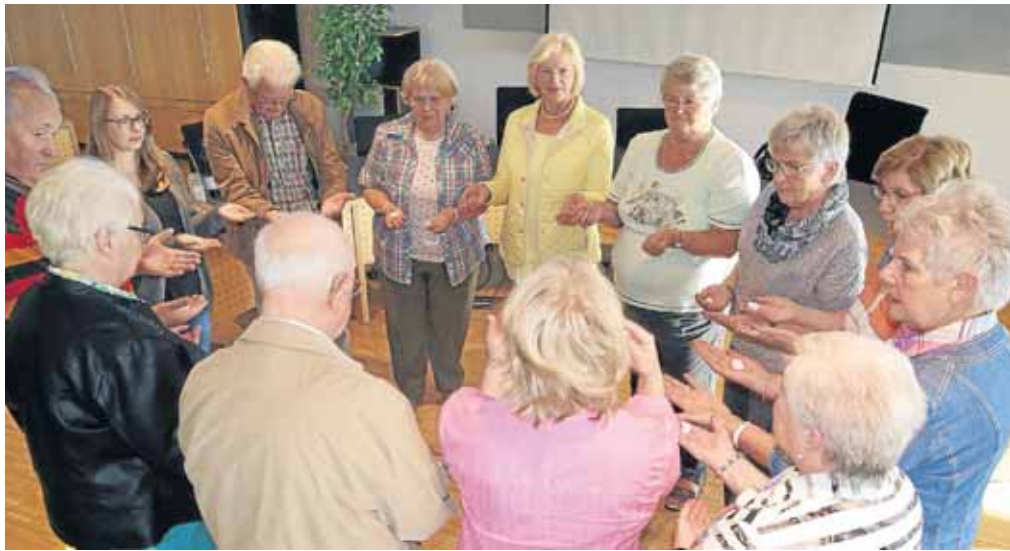
Bei einer Konzentrationsübung musste ein Stein über Kreuz an den Nachbarn weitergegeben werden.

Die Übungen stellen eine Herausforderung dar und sind auf die persönlichen Stärken und den Gesundheitszustand der Teilnehmer abgestimmt. Jede Kursstunde