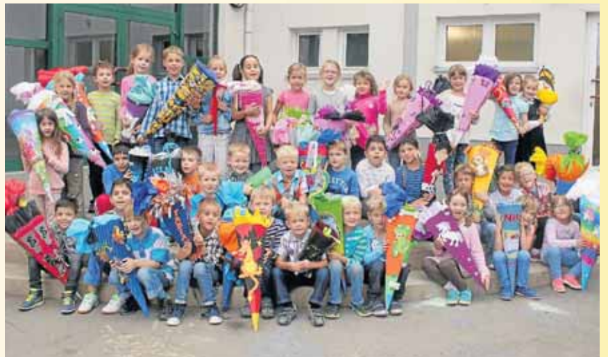
Die neuen Erstklässler aus Niedernetphen präsentierten ihre vollgepackten Schultüten.