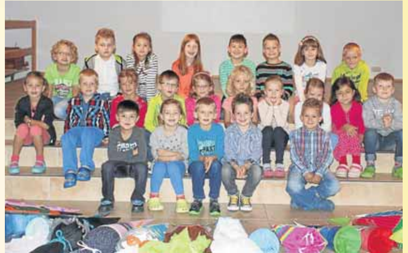
In Obernetphen begann jetzt für die Schulanfänger ein neuer Lebensabschnitt.