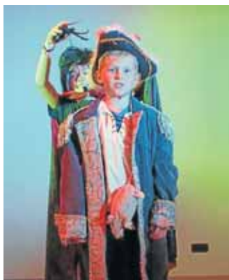
Die kleinen Schauspieler präsentierten einen Ausschnitt aus dem nächsten Musical.

Zum krönenden Abschluss tanzten die Eltern als Überraschung mit dem ganzen Saal den „Time Warp“ aus der „Rocky Horror Picture Show“.