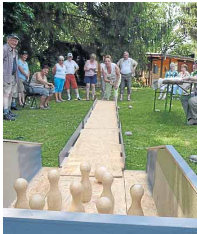
Auf der transportablen Kegelbahn ließen die Familien die Kugeln rollen.

rei kennen gelernt haben und sie selbstständig nutzen können. Diese Bibliotheksführerscheine wurden im Rahmen von Büchereifesten, zu denen auch die Eltern und Erzieherinnen eingeladen waren, überreicht.