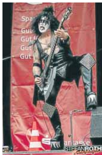
Stefan Rother fotografierte die Kiss-Double „Cold Gin“.