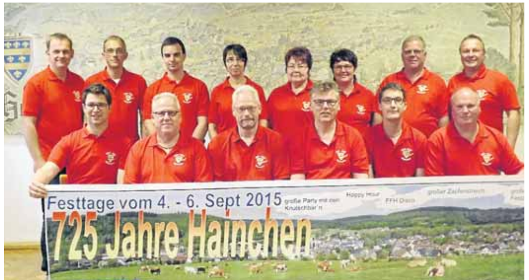
Das Festkomitee bereitet das große Festwochenende „725 Jahre Hainchen“ vor.

Gestartet wird am Freitagabend, 4. September, mit der Discoparty im großen Festzelt, veranstaltet von Hitradio FFH. Weitergefeiert wird am Samstagabend, 5. September, mit einem bunten Abend im großen Festzelt. Für musikalische Unterhaltung sorgt „Sepp und seine Steigerwälder Knutschbär'n“. Die Sieben-köpfige Show- und Partyband ist eine aktive Live-Band, das heißt, bei allem was gespielt wird, wird das Publikum voll mit einbezogen. Aktuelle Chart-Titel und Partymusik erwartet das Publikum. Weitere Infos zur Band gibt es unter www.knutschbaer.de . Der Sonntag, 6. September,