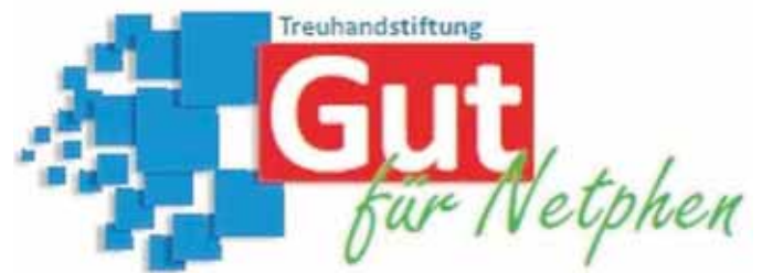
Die Stiftung „Gut für Netphen“ hat ein Logo entwickelt.

Derzeit ist eine Internetseite und eine Broschüre für Stifter und Förderer in der Vorbereitung. Derzeit ist eine Internetseite und eine Broschüre für Stifter und Förderer in der Vorbereitung.