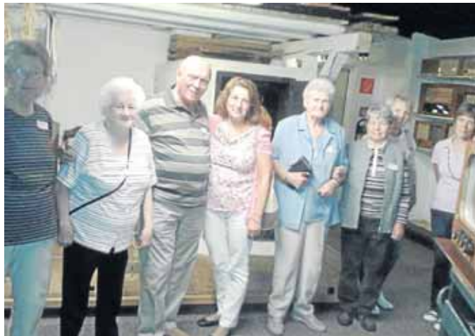
Die Betreuungsgruppe vom Verein „VergissMeinNicht Netphen“ besuchte das Museum in Wilnsdorf.