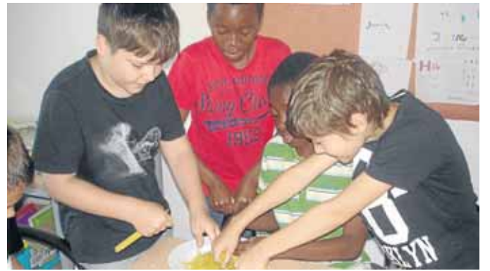
Die Kinder lernten, wie man brät und kocht.