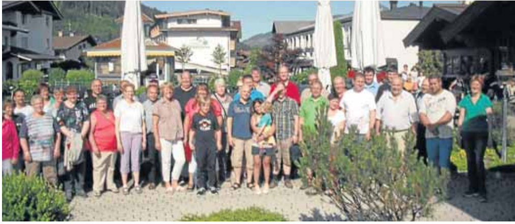
Die Sänger des Chors Einigkeit Herzhausen reisten nach Kirchberg in Tirol, um dort am zweiten Internationalen Gesangsvereinstreffen teilzunehmen.