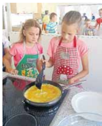
Die Kinder bereiteten zusammen internationale Gerichte zu.

mittag überschrieben, den die Netphener Senioren-Service-Stelle zusammen mit dem Familienbüro im Rahmen der Netphener Ferienspiele organisiert hatte. Das Ziel war, Jung und Alt zusammenzubringen.