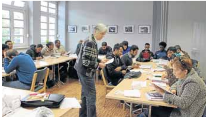
Mittlerweile gibt es drei Kurse in Dreis-Tiefenbach, in denen die Flüchtlinge und Migranten Deutsch lernen.

Der Deutschkurs bietet die Möglichkeit des Spracherwerbs in gelockelter Atmosphäre. Gleichzeitig können die Teilnehmer mit anderen interagieren und Kontakte für die Zukunft knüpfen.