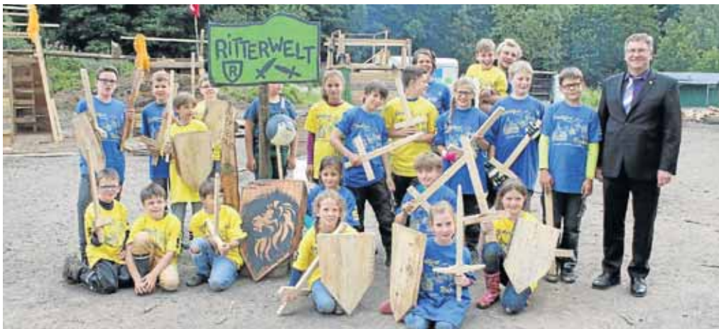
Bürgermeister Paul Wagener besuchte das „Hüttendorf“. Die Kinder errichteten dort eine „Ritterwelt“ nach ihren eigenen Ideen.

Bürgermeister Paul Wagener besuchte das „Hüttendorf“ und überreichte den Kindern T-Shirts der 775-Jahr-Feier.