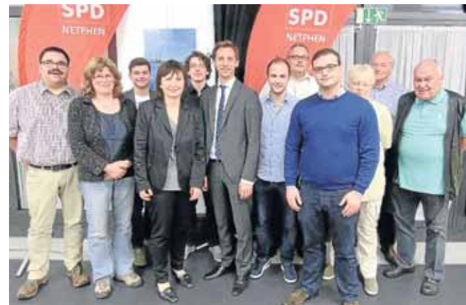
Der Vorstand des SPD-Ortsvereins Netphen freute sich über den Besuch des Landrats Andreas Müller (Mitte).

Weitere Aktivitäten des Ortsvereins waren 2014 die traditionelle Mitwirkung am AWO-Sommerfest und die Teilnahme am Stadtteilstift am Heckersberg mit einem Luftballon-Weitflugwettbe-