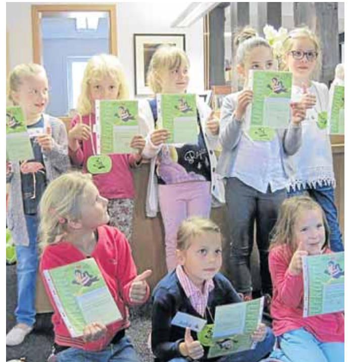
Die Vorschulkinder des St. Elisabeth-Kindergarten Brauersdorf freuen sich über ihren „Bibfit-Führerschein“.

Bei vier Besuchen lernten die Kinder: 1. aussuchen und ausleihen, 2. vorlesen, zuhö-