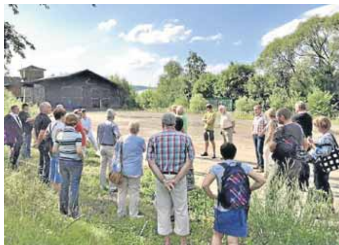
Der „Sommerreise“ der SPD führte nach Dreis-Tiefenbach, Unglinghausen und Deuz.