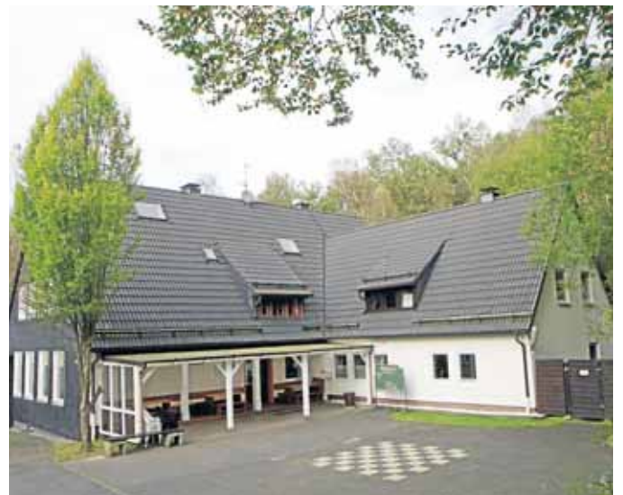
Die Ruhe täuscht: In Beienbach ist fast immer etwas los. Dafür sorgt die aktive Dorfgemeinschaft.