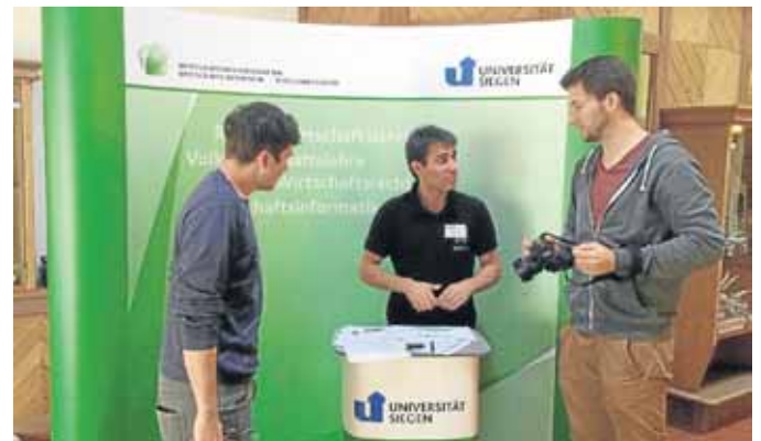
Der Fachschaftsrat veranstaltete für die neuen Erstsemester einen „Activity Day“ im Sportpark.

Der Nenkersdorfer Dorf-Kultur- und Sportförderungsverein (DKS) hatte zum Backesfest rund um das Backhaus eingeladen. Bei strahlendem Wetter kamen zahlreiche Besucher, um die Köstlichkeiten aus dem Backhaus zu genießen. So wurden auch in diesem Jahr vom Heimatverein neben dem Backesbrot und Reibekuchen zahlreiche köstliche Kuchenkreationen den Gästen angeboten.