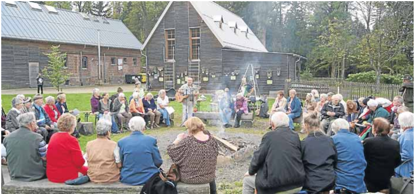
Mit dem gemeinsamen Singen am Lagerfeuer endete der „Waldeslust“-Tag.

Netphen. Das Familienbüro der Stadt Netphen führt derzeit eine Familienbefragung durch. Diese soll dazu dienen, die Stadt Netphen noch familienfreundlicher und kindgerechter zu machen. Nur durch die Mithilfe der Bürger kann in Erfahrung gebracht werden, wo der „Schuh“ wirklich drückt und was die Stadt Netphen tun kann, um den Familien und Mitmenschen das Wohnen und Leben in Netphen noch angenehmer und interessanter zu machen. Die Fragebögen wurden in allen Schulen und Kindergärten verteilt. Ferner liegen sie im Rathaus der Stadt Netphen beim Familienbüro, Bürgerbüro und an der Zentrale aus und stehen auf der Homepage zum Download bereit. Das Familienbüro hofft auf eine gute Beteiligung und bedankt sich im Voraus bei allen Bürgern, die sich bereits ein paar Minuten Zeit genommen und die Arbeit des Familienbüros damit unterstützen.