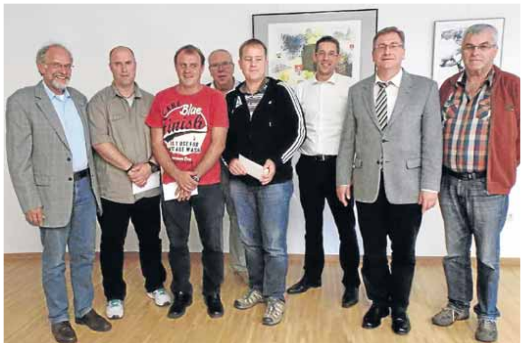
Der Stadtsportverband und die Stadt Netphen zeichneten die Sportvereine für ihre vorbildliche Jugendarbeit aus.