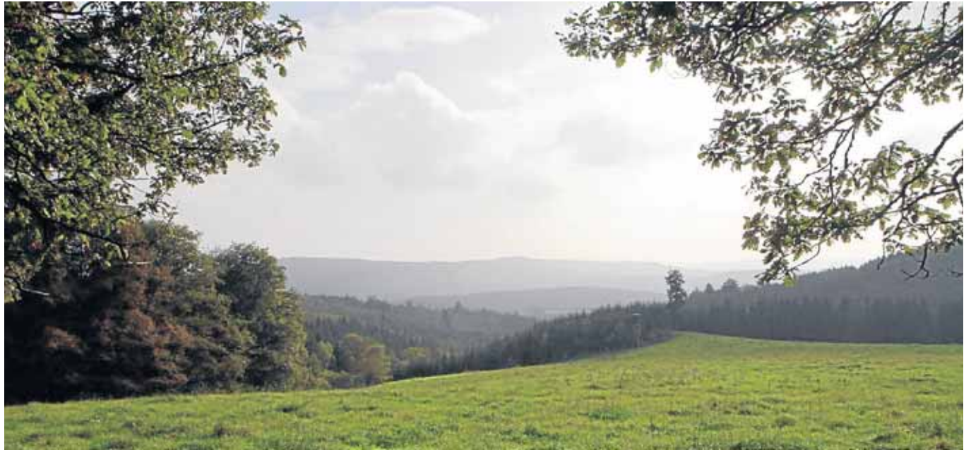
Die Idylle ist in Beienbach nur eine Seite der (Gold-)Medaille: Großes Engagement und das beispielhafte Miteinander von Jung und Alt prägen das 339-Seelen-Dorf.

Der Genossenschafts-Gedanke ist in Beienbach seit jeher verwurzelt. Bestes Beispiel dafür ist die Gefriergemeinschaft, die es sich zur Aufgabe gemacht hat, ihren Mitgliedern die Möglichkeit zu bieten, Lebensmittel dauerhaft einzufrieren und konstant küh-