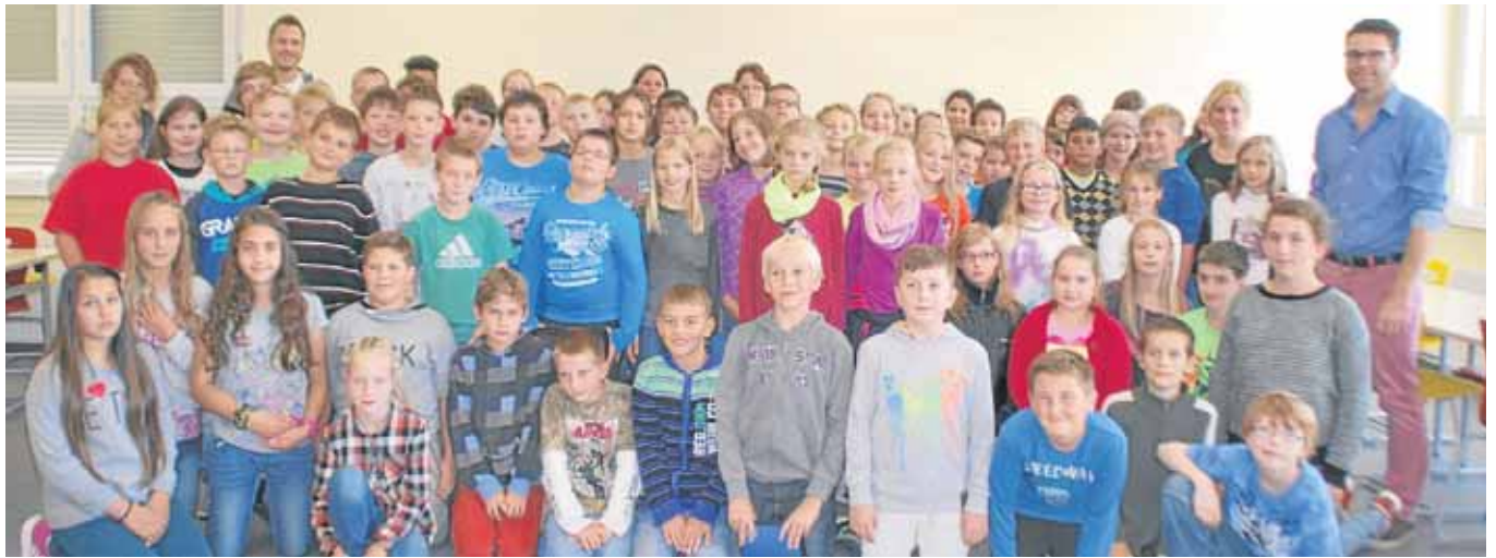
Die neuen Fünftklässler sind da: Mit 270 Schülern ist die Sekundarschule Netphen jetzt zur Hälfte aufgebaut. Insgesamt 29 Lehrer kümmern sich um die Jungen und Mädchen.

Netphen. In der vergangenen Zeit ist es im Bereich einiger Altglassammelcontainer wiederholt zu Anwohnerbeschwerden gekommen. Die Stadt Netphen weist daher nochmals auf Folgendes hin: Glas ist ein wertvoller Rohstoff. Deshalb hilft Glasrecycling unserer Umwelt und spart zudem Energie. Wichtig ist, dass wirklich nur restleerte Glasverpackungen wie zum Beispiel Getränkeflaschen, Konservengläser, Flakons aus Glas und sonstiges Verpackungsglas in die Altglas-Sammelbehälter eingeworfen werden. Der Einwurf hat nach Farben getrennt (Weiß-, Grün- und Braunglas) zu erfolgen. Die Einwurf-Zeiten sind in der Abfallentsorgungssatzung auf werktags von 7 bis 20.30 Uhr beschränkt. Keinesfalls dürfen die Container an Sonn- und Feiertagen sowie außerhalb dieser Einwurf-Zeiten befüllt werden. Dies stellt eine Ordnungswidrigkeit dar und wird wegen der unnötigen Lärmbelastigung/Ruhestörung der Anwohner entsprechend verfolgt und geahndet. Im Interesse der Anlieger wird außerdem darum gebeten, bei der Befüllung unnötigen Lärm zu vermeiden und keine Rückstände, wie Verpackungen oder Kunststofftüten, zu hinterlassen.