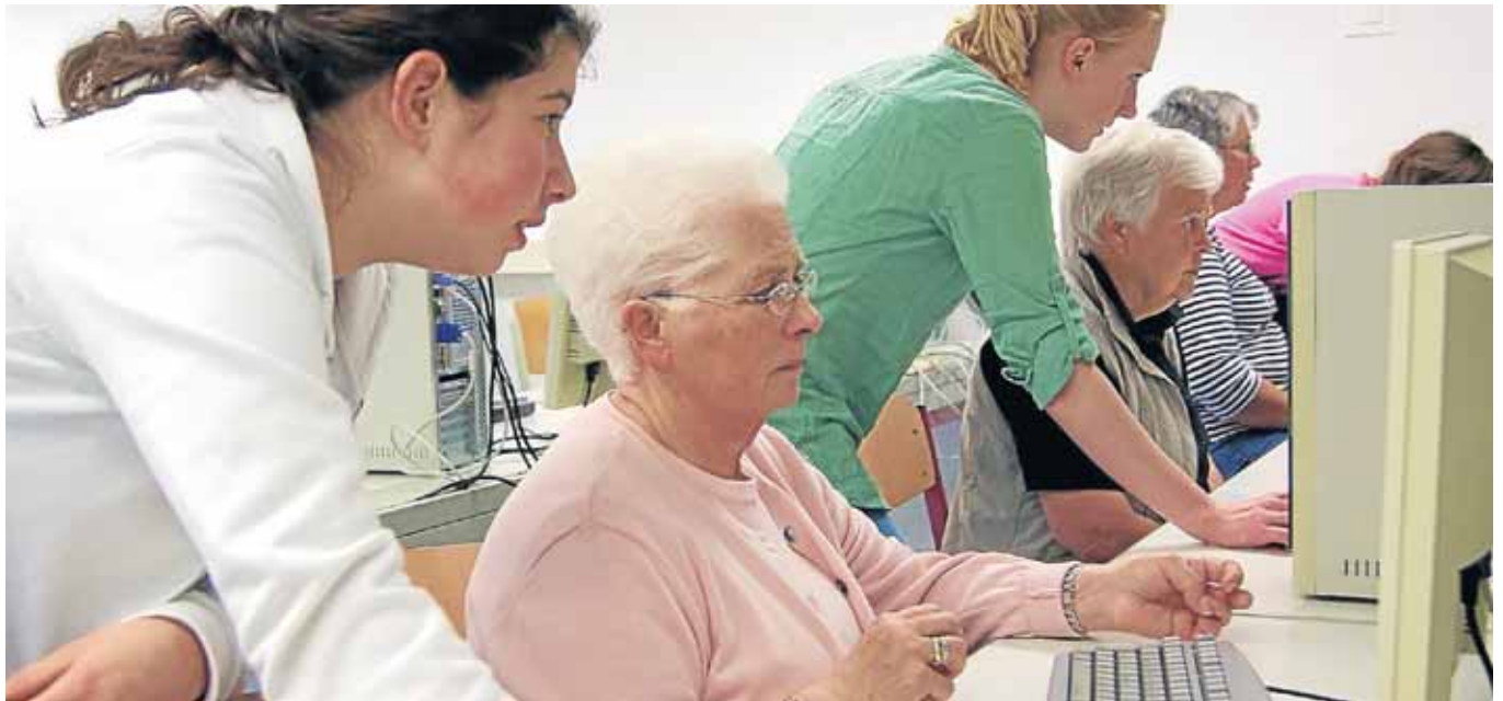
Das Projekt „Neuland“ startet wieder am Freitag, 24. Oktober, im Forum des Gymnasiums.

Was steht in diesem Jahr auf dem Programm? Neben einem Handy- bzw. Smartphone-Kurs, in dem die praktische Anwendung eines mobilen Telefons vermittelt wird, stehen auch wieder Computer-Kurse für Anfänger und für