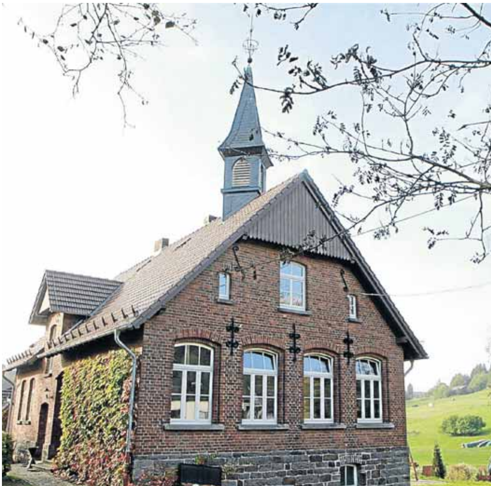
Die alte Kapellenschule ist der Mittelpunkt des dörflichen Lebens in Beienbach, das im Jahr 1299 erstmals urkundlich erwähnt wurde.

vember findet der Laternenzug für jedermann um 17.30 Uhr von der Dorfmitte aus statt. Am 15. November werden ab 13 Uhr im Backhaus Plätzchen für einen guten Zweck gebacken. Und am 6. Dezember findet in der Alten Schule die Nikolausfeier des Heimat- und Bürgervereins statt.