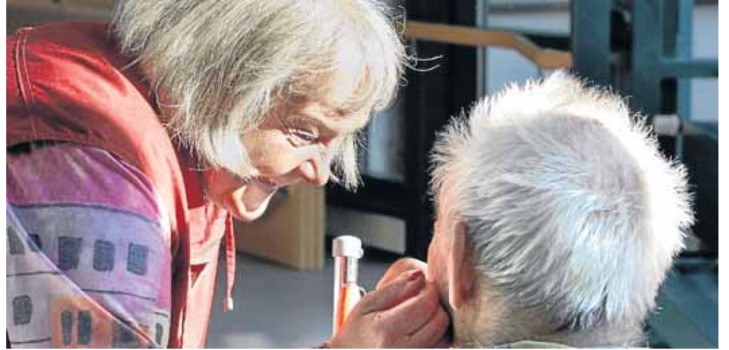
Der Verein „VergissMeinNicht Netphen“ unterstützt Menschen, die ihre kranken Angehörigen pflegen.