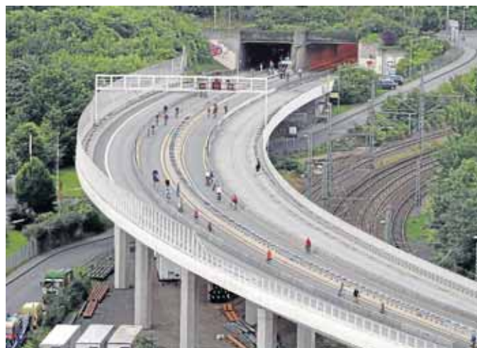
Einmal jährlich gehört die Hüttentalstraße – wie hier am Ziegenbergertunnel – den Radfahrern.

Kölner Str. 1a - 57250 Netphen-Deuz - Tel. 02737-2140800