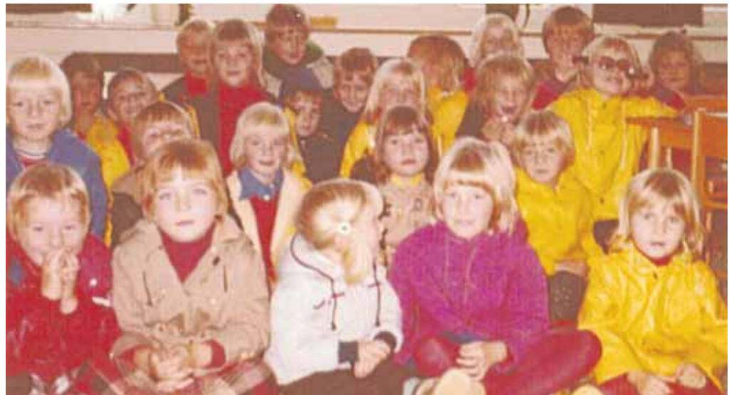
Die „Gründungskinder“ aus dem Jahr 1974. Am heutigen Sonntag, 29. Juni, feiert der Kindergarten sein 40-jähriges Jubiläum.

dem sie einen Gottesdienst zur Arche Noah-Geschichte mitgestaltet haben. So wie die Farben des Lichtes im Regenbogen vereint sind, kommen seit mehr als 30 Jahren die Kinder im Kindergarten zusammen.