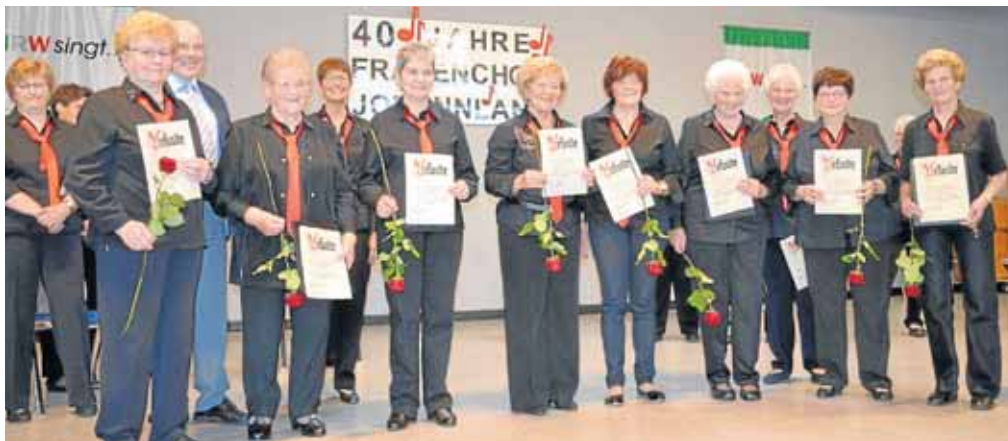
Zahlreiche Sängerinnen, die von der ersten Stunde dem Frauenchor die Treue halten, wurden während der Jubiläumsfeier geehrt.