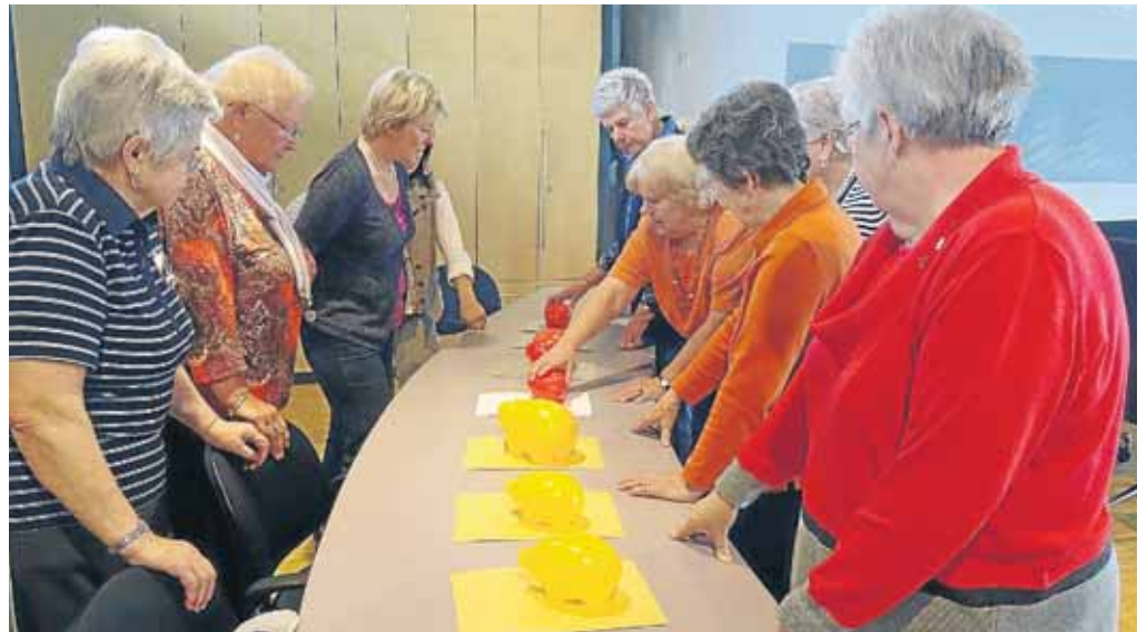
Nicht nur das eigene „Oberstübchen“ wird beim Gedächtnistraining auf Trab gebracht. Es fördert auch die sozialen Kontakte.