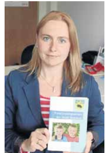
Den neuen Familienwegweiser gibt es unter anderem im Familienbüro der Stadt.

Netphen. Der neue „Familienwegweiser der Stadt Netphen“ ist erschienen und gibt nicht nur Auskunft über die Netphener Kindergärten, Familienzentren und Schulen, sondern auch Tipps und Hinweise zu verschiedenen Fördermöglichkeiten für Familien, zur Freizeitgestaltung sowie zu Beratungs- und Hilfsangeboten. Den Familienwegweiser erhalten Interessierte unter anderem im Familienbüro, den Familienzentren, Kindergärten, Schulen und im Bürgerbüro der Stadt Netphen. Natürlich steht der Familienwegweiser auch zur Ansicht und zum Download unter www.netphen.de bereit.