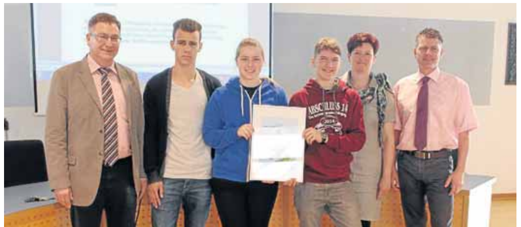
Die Schüler der Realschule und des Gymnasiums Netphen teilten sich den diesjährigen Klimaschutzpreis der Stadt Netphen.