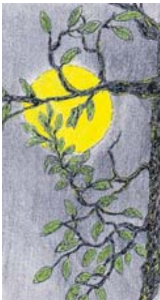
Formatfüllend: „Der Mond“.