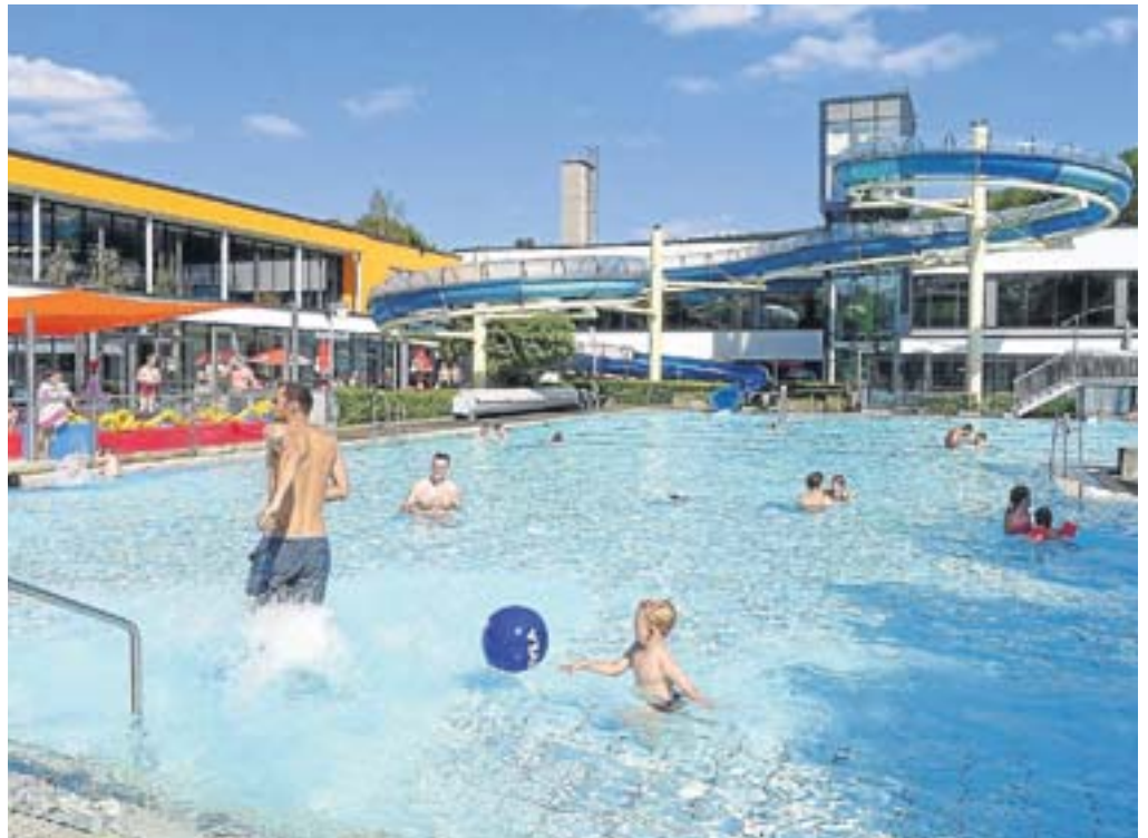
Vorm Herbst nochmal ordentlich Sommer tanken beim Tag der offenen Tür im Freizeitbad.

Der Eintritt ist frei. Der Badebetrieb kann durch die Aktionen eingeschränkt sein. Da die Sauna zur Besichtigung offen ist, findet kein Saunabetrieb statt. Um auch den Familien zu helfen, denen es nicht so gut geht, findet wieder eine Spendensammlung zugunsten der Aktion Lichtblicke statt.