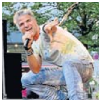
Die Sharks eröffneten gekonnt den Konzert-Reigen.

Die Veranstalter sagen Danke an die vielen Sponsoren und das treue Publikum und ganz besonders an Petrus für traumhaftes Wetter. Man freut sich schon jetzt auf 2014.