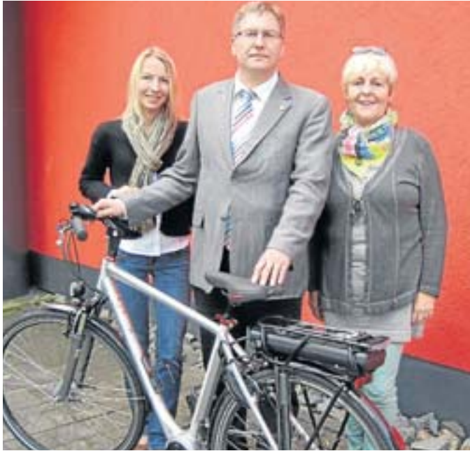
Die Netphener E-Bikes sind eine kleine Spritztour allemal wert. Die Stadtverwaltung steht voll dahinter.