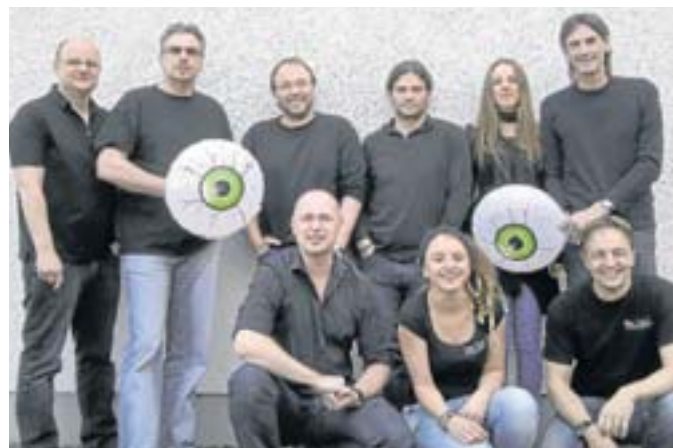
Pink Pulse bieten den einzigartigen Sound von Pink Floyd.

gestellt, das mit dem Konzert im Rahmen der Philharmonie Südwestfalen der 775-Jahrfeier im August 2014 hochwertig abschließt.