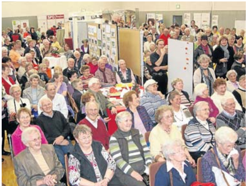
Der Netphener Seniorentag orientiert sich direkt an den Bedürfnissen der Beusucher.

Im Internet sind das Anmeldeformular und Infos zu diesem und weiteren das Seminare in der Jahresbroschüre 2013 unter www.Merzis-Musiklabor.de zu finden.