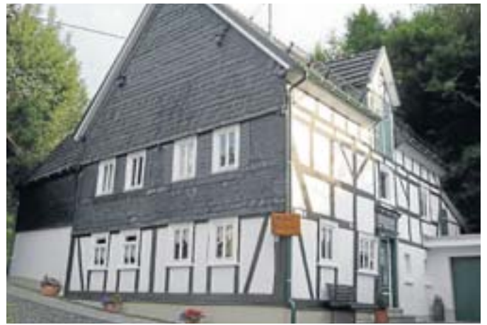
Nicht mehr wegzudenken aus dem Ort: das Heimatzentrum.

Dreis-Tiefenbach. Und schon sind 25 Jahre vorbei – Innerhalb dieser Zeit hat sich der Heimatverein „Alte Burg“ Dreis-Tiefenbach deutlich entwickelt: Von einer kleinen Truppe, die sich auf Zuruf traf, um die eine oder andere Verschönerung des Dorfbildes in Angriff nehmen, hin zu einem mittelgroßen Verein von ca. 130 Mitgliedern, wovon rund 20 bis 30 Aktive ein regelmäßiges Jahresprogramm im Rahmen der Dorfgemeinschaft gestalten.