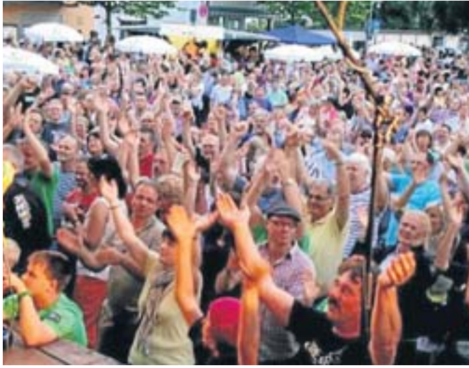
„Die Hände zum Himmel“: Party auf dem Rathausplatz.