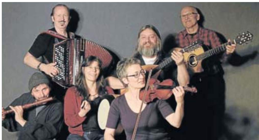
Molly Ban spielen handgemachten Folk mit erfrischender Leidenschaft.