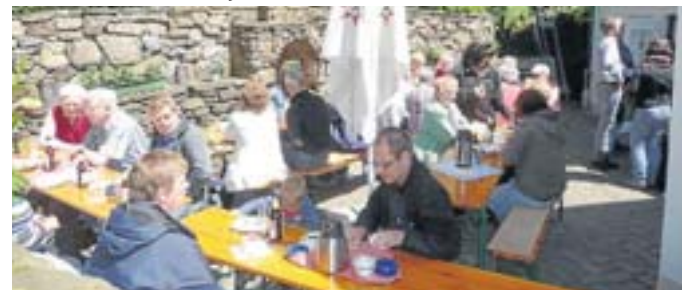
Gemütlicher Veranstaltungs-Treffpunkt: der Innenhof.

Aktuell findet am 1. Dienstag im Monat der therapeutische Musiktreff „con musica“ statt. Es soll ein Vortragssaal mit einer dritten Ausstellung „Produkte der Eisenverarbeitung in Landwirtschaft, Handwerk und Alltag“ eingerichtet werden und ab Anfang 2014 vorzeigbar und nutzbar sein. Weitere Infos unter www.heimatverein-alte-burg-dreistiefenbach.de .