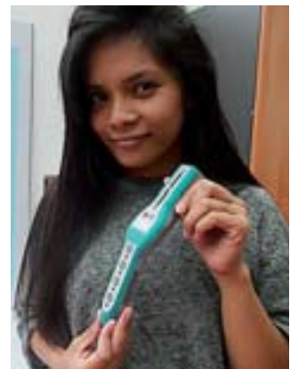
Mit solchen Softlaser-Geräten arbeitet das Team von ROTAL-LASER im Bereich der Raucherentwöhnung.

eines ausführlichen Beratungsgesprächs ca. 1 ½ Stunden. Im lichterdurchfluteten Praxisraum von ROTAL-LASER findet in entspannter und angenehmer Atmosphäre die völlig schmerzfreie Anwendung statt. Schon während der Behandlung kommt ein Gefühl des Wohlbehagens auf, das durch beruhigende und entspannende Musik noch verstärkt wird, da gewisse Frequenzbereiche verwendet werden, die positive Körperreaktionen initiieren. Es ist eine völlig risikofreie Behandlung, die in dieser Kombination einzigartig ist, natürlich ohne Schmerzen, Einstiche oder Infektionsgefahr und komplett ohne negative Nebenwirkungen. Neben der Raucherentwöhnung (auf Wunsch auch mit Gewichtskontrolle, um nicht unnötige Pfunde zuzunehmen) können auch weitere Akupunktur-Punkte durch den Softlaser angesprochen werden, die dann wesentliche Voraussetzungen zur Stressbewältigung schaffen, oder kombiniert mit Rezeptempfehlungen zur kalorienarmen Ernährung der Gewichtsreduzierung dienen. Eine weitere interessante Anwendung von ROTAL-Laser soll das Volksleiden Tinnitus bekämpfen. Tinnitus (nach dem lateinischen tinnire = Klingeln) umfasst alle Arten von Geräuschen und Tönen, die ohne eine äußere Schallquelle in den Ohren oder generell im Kopf wahrgenommen werden. Bei dieser Methode durchdringt der Laserstrahl im Ohr selbst tiefer