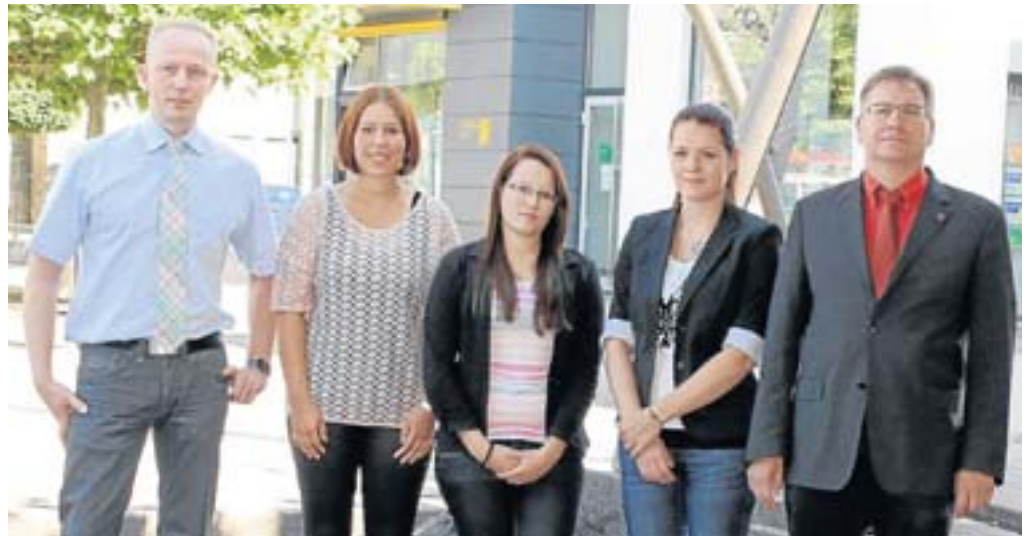
Erfolgreiche Nachwuchsarbeit: Den Neuen im Team steht man hilfreich zur Seite.