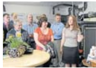
Für großes Interesse sorgte das Blockhauskraftwerk.

Per Reisebus fuhren die Teilnehmer in jeder beteiligten Kommune je einen Besichtigungsort an, der im Themenfeld Energie und Klima Bedeutung hat. Beteiligt am Klimaschutzprojekt sind die