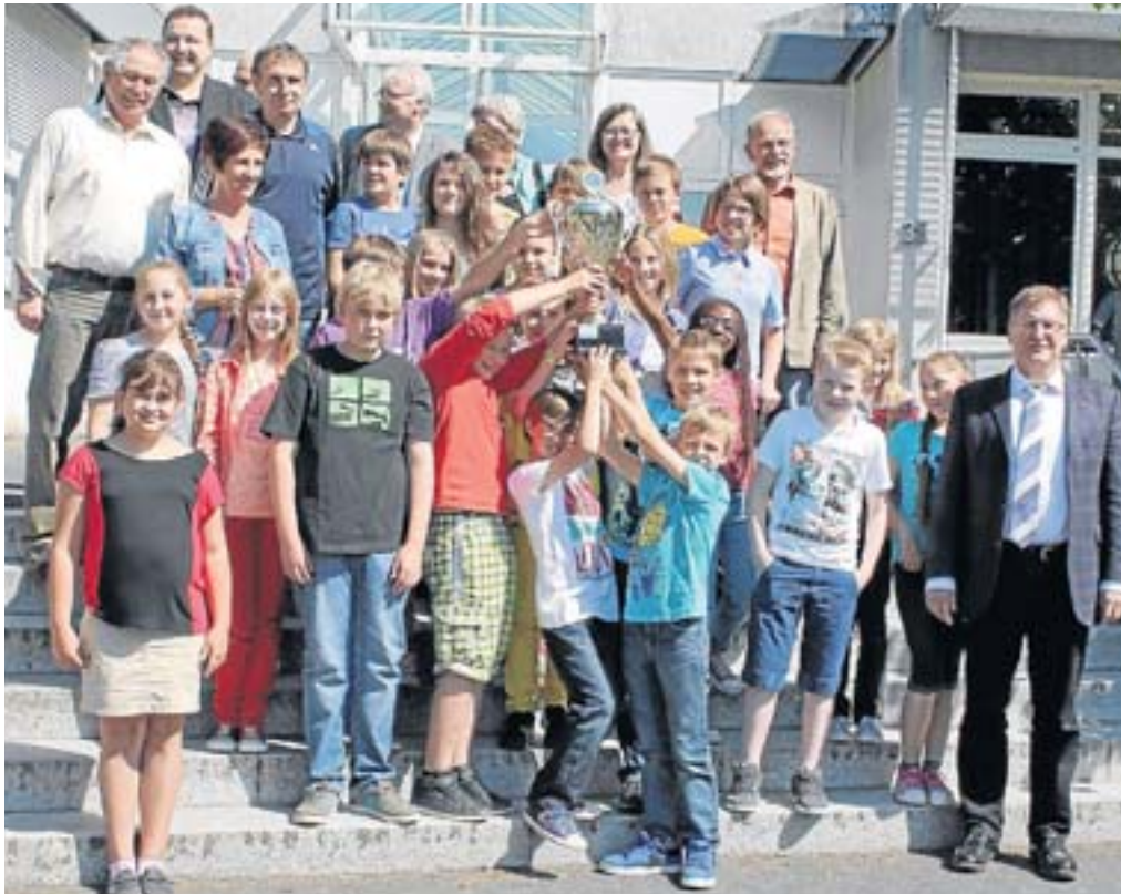
Stolz auf das Geleistete: Die Klasse mit den meisten Sportabzeichen nahm stellvertretend für die gesamte Schülerschaft aus den Händen ihres Schulleiters den Pokal entgegen.