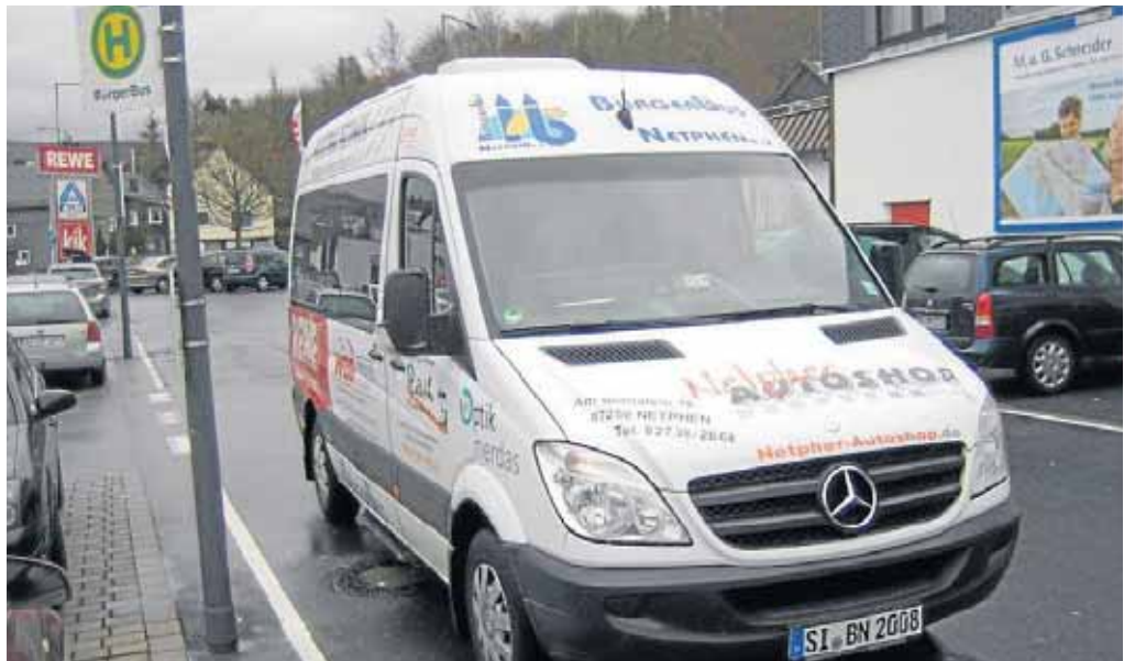
Der Bürgerbus kommt: Für viele Fahrgäste gehört er bereits unverzichtbar zum Alltag.

Der Eintritt kostet acht Euro. Schnell Karten sichern. Die gibt es ab sofort im Kulturbüro und im Bürgerbüro Netphen.