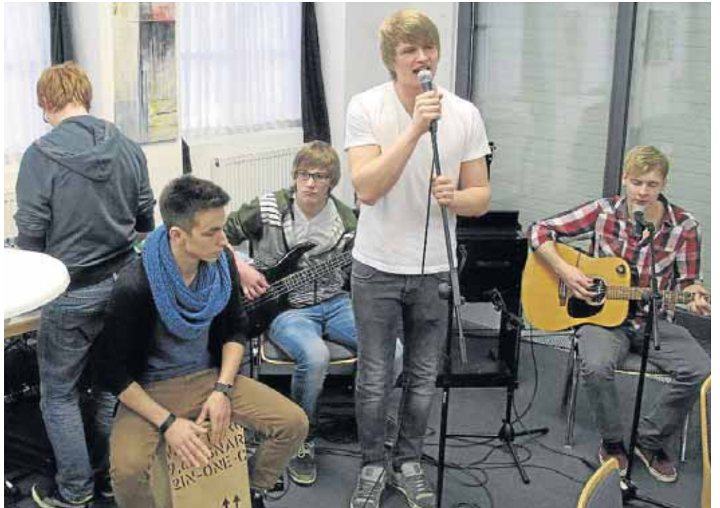
Schüler des Gymnasiums gestalteten die Gedenkveranstaltung im Alten Feuerwehrhaus durch ihre Musikbeiträge mit.

Wer sich für das Thema Hausnotruf interessiert, ist am Mittwoch, 10. April um 15 Uhr zur Info-Veranstaltung: Informationen zum Hausnotruf mit Udo Sieker vom DRK Kreisverband herzlich willkommen. Am Mittwoch, 24. April von 15 bis 17.30 Uhr kommen Groß und Klein wieder zusammen. Auch hier sind nur noch wenige Plätze verfügbar. Der Anmeldeschluss läuft jedoch noch bis zum 13. April. Informationen oder Anmeldungen zu den Angeboten bei Jutta Weber unter ☎ 02733/513 55.