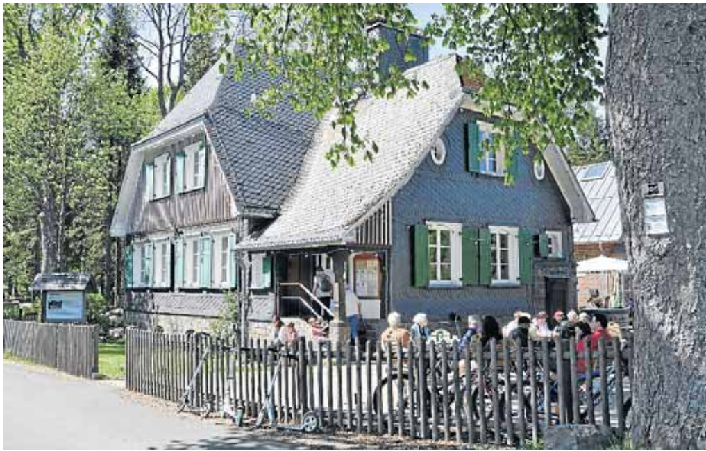
Gehrt zu den Empfehlungen der Autorin: das Forsthaus Hohenroth