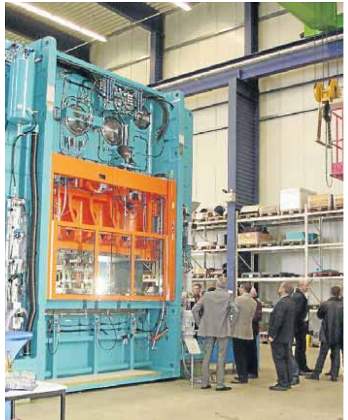
Was für ein Gerät: Im Rahmen einer Live-Präsentation konnte die neue Presse in Aktion begutachtet werden.

Hierfür hat das mittelständische Unternehmen aus dem Siegerland das bewährte Konzept der Kniehebelpresse mit Servoantrieb weiterentwickelt. Hauptmerkmal der neuen Baureihe ist die deutlich erhöhte Steifigkeit des Gesamtsystems, die einen minimalen Schnittspalt ermöglicht. Das Ergebnis sind Bauteile mit sehr glatten und ebenen Schnittflächen und besonders rechtwinkligen Schnittkanten. „Durch die hohe Steifigkeit der Anlage ist eine sehr präzise Führung des Werkzeuges möglich. In Ver-