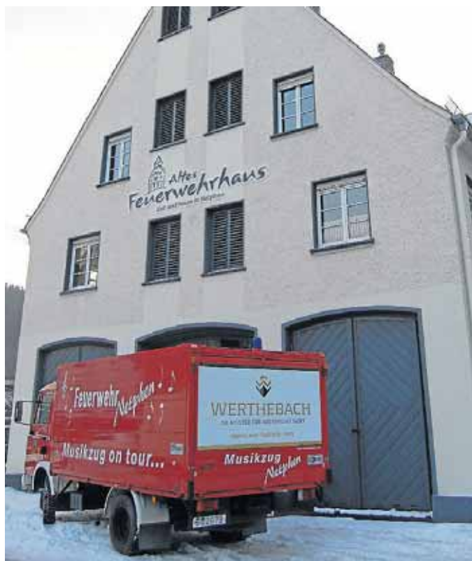
Zeit wird's: Der Musikzug der Feuerwehr spielt passend zum Frühlingsbeginn.

Angesichts der gesetzlichen Rahmenbedingungen, staatlich festgelegten und gesicherten Netzentgelte sowie des niedrigen Zinsniveaus bietet sich hier eine einmalige historische Chance auch für die Stadt Netphen, das Thema Energienetze nun in die eigenen Hände zu nehmen. Die Energiewende findet vor Ort statt.