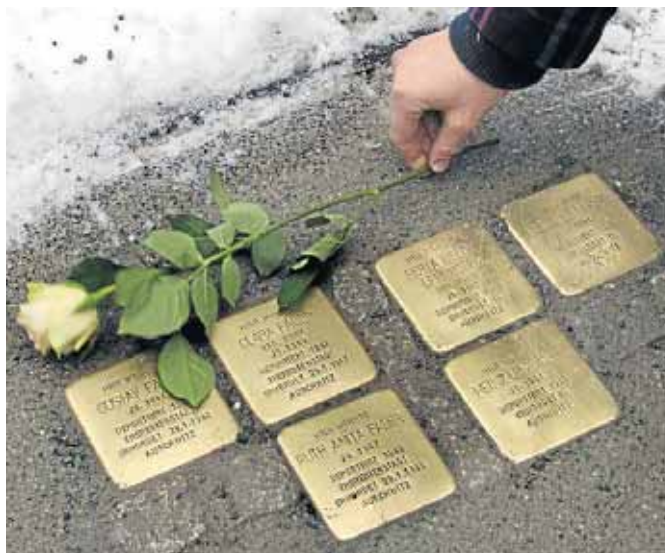
Ein Zeichen des tiefen Gedenkens.