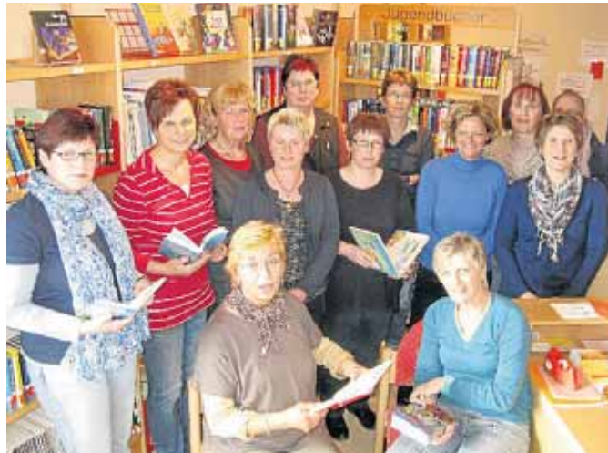
Echte Bücherfreundinnen: Das Team der KÖB Netphen.

Die evangelische wie auch die katholischen Büchereien werden seitens der Stadt Netphen mit jährlich insgesamt 6000 Euro unterstützt. Dieser Betrag floss den Büchereien bis Mitte der 90er Jahre über den kommunalen Haushalt zu. Mit Einführung des ersten Haushaltssicher-