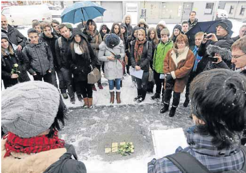
Man ist sich einig: „Ein Mensch ist nur dann vergessen, wenn sein Name vergessen ist.“