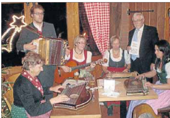
Zünftiger Adventsbeginn in der Wasserburg Hainchen.

Kölner Straße 40 57250 Netphen Tel. 0 27 37 / 31 77