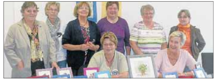
Spaß und Geselligkeit stehen beim Kreis im Vordergrund.

Netphen. Ein neuer Handarbeitskreis trifft sich seit Oktober im Rathaus der Stadt Netphen. Wer gerne strickt, häkelt oder stickt, ist hier richtig. Das Alter ist dabei egal. Auch Anfängerinnen sind jederzeit willkommen und erhalten Hilfe und Anregung. Dabei steht nicht nur die Kreativität im Vordergrund, auch der gesellige Aspekt soll nicht zu kurz kommen. Die offene Handarbeitsgruppe trifft sich immer donnerstags von