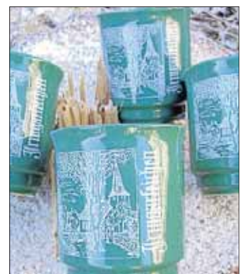
Da schmeckt's nochmal so gut: Keramik-Trinkbecher.

nachtlicher Atmosphäre ein. Die Musikkapelle Irmgarteichen wird die Veranstaltung musikalisch begleiten. Zum Schutz der Umwelt verzichten die Organisatoren auf Einweg-Trinkgefäße und bieten den Gästen Keramik-Trinkbecher mit Irmgarteichener Motiv für Glühwein, Glühkirschen und Cäcilium an. Gegen 15.30 Uhr werden St. Nikolaus und Knecht Ruprecht zur Freude kleiner Gäste erwartet. Der Gesamterlös wird wie bisher sozialen Zwecken zugeführt.