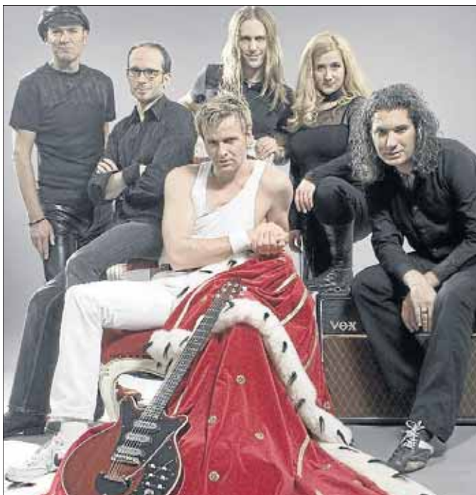
Lieben den großen Auftritt: The Queen Kings.