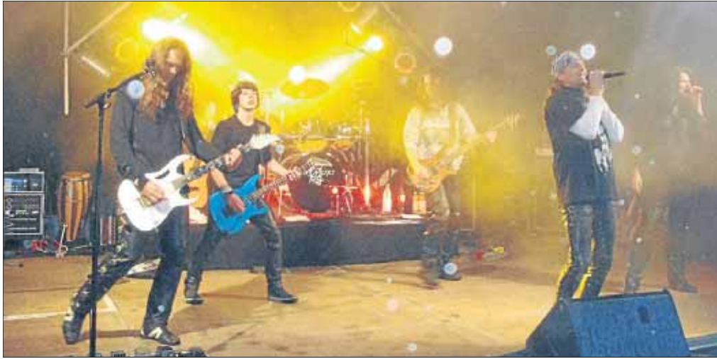
Stehen nicht für „Stille Nacht“: Harakiri freuen sich schon auf eine tolle Party.