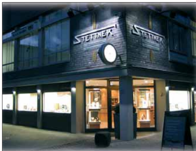
EKZ · Neumarkt 11 · Netphen

STETTNER UHRMACHERMEISTER · GOLDSCHMIEDEMEISTER