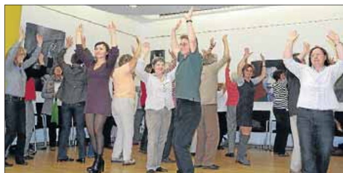
Mitmachen war angesagt bei vielen angebotenen Aktionen.