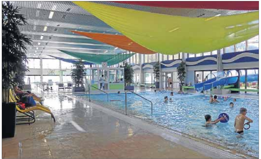
Hier fühlt man sich wohl: Das Freizeitbad Netphen setzt auf Erlebnisqualität.

Netphen. Man kann gar nicht früh genug damit anfangen: Der Verein für Verkehrserziehung Deutschland hat im Rahmen der Aktion „Spaß auf der Straß: Mit Sicherheit“ für alle Netphener Kindergärten das Verkehrsbuch „Straßengeschichten mit Moritz und Luise“ zur Verfügung gestellt. Ziel dieser Aktion ist es, die jüngsten Verkehrsteilnehmer mit einem lehrreichen und leicht verständlichen Verkehrserziehungsbuch nachhaltig dabei zu unterstützen, die Gefahren und Regeln im Straßenverkehr zu lernen. So werden die Kinder frühzeitig und spielerisch an dieses wichtige Thema herangeführt. Die Stadt Netphen bedankt sich bei den örtlichen Sponsoren, die dieses Projekt unterstützt haben.