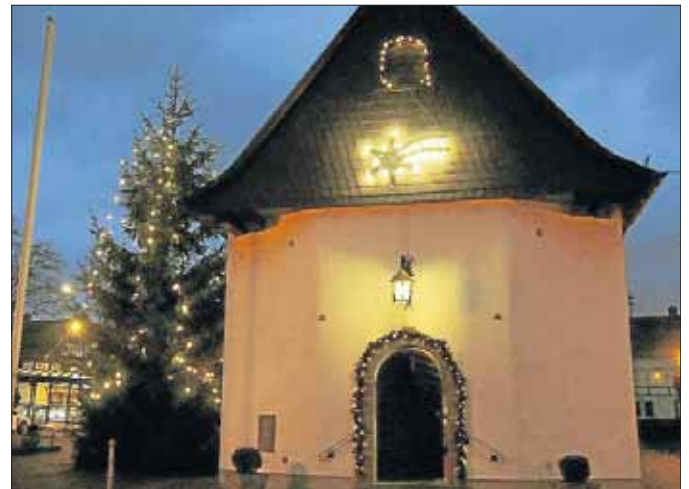
Festlich geschmückt ist in der Advents- und Weihnachtszeit die St. Peterskapelle in Netphen.

Uhr: Kath. Gottesdienst – Hl. Messe zum St. Johannes-Evgl.