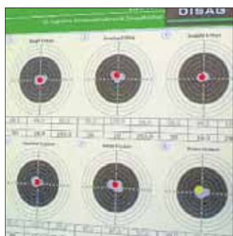
Die Auswertung der Ergebnisse wird bei der neuen Anlage digital vorgenommen.

nerhalb von zehn Wochen wurde der Neubau erstellt; rund 1200 ehrenamtliche Arbeitsstunden flossen in die Maßnahme. Im Anschluss an die Grußworte wurde ein Ligawettkampf zwischen einer Südwestfalenauswahl und einer Johannlandauswahl ausgetragen, den die Gäste auf Leinwand verfolgen konnten.