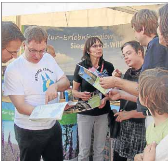
„Schauen Sie mal“: Großes Interesse gab's an der Region.

Nicht nur Rheinländer informierten sich über aktuelle Rad- und Wanderangebote wie den Köhlerpfad. Auch zahlreiche Siegerländer Besucher ließen es sich nicht nehmen, sich über die vielfältigen Freizeitmöglichkeiten in ihrer Region zu informieren. In guter Tradition fand zum 13. Mal die Radtour „Von der Quelle bis zur Mündung“ statt. Der Verkehrsverein Netphen orga-