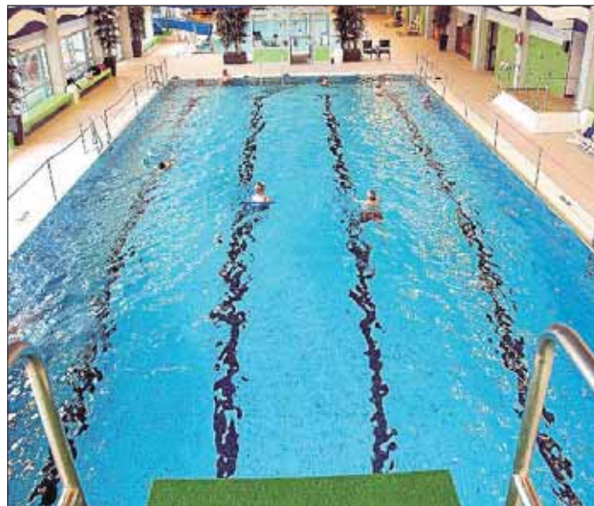
Rein ins (gar nicht) kühle Nass: So hält man sich fit.

Auch technisch wurde das Freizeitbad Netphen auf neuen Stand gebracht. Die Gebäudehülle wurde gedämmt, die Heizungsanlage erneuert und eine Solarabsorberanlage zur Warmwasserbereitung wurde auf das Dach montiert. Das neue Blockheizkraftwerk erzeugt neben der Wärme für das Gebäude auch Strom. Für nächstes Jahr sind als Abschluss der Gesamtmaßnahme noch der Bau der Außensauna, die Neuverglasung des Rutschenturms und die Montage eines Kleinkinderbeckens für das Freibad vorgesehen.