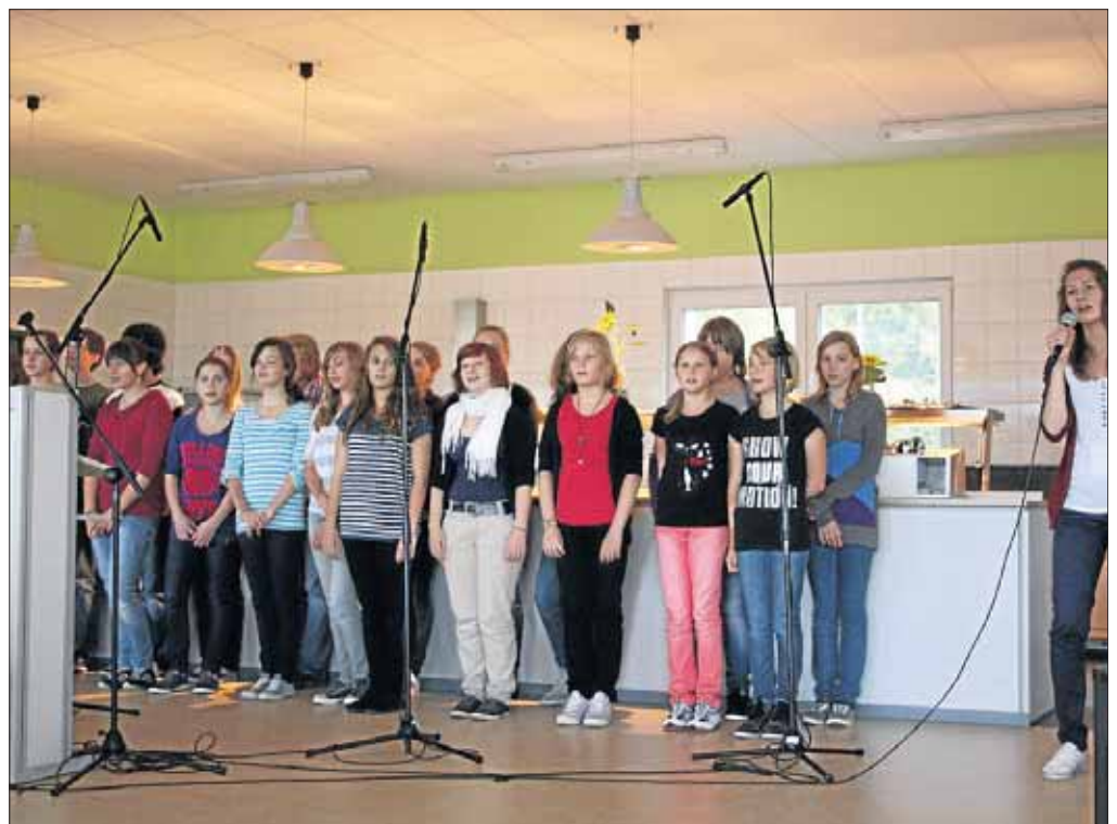
Mit einem kurzweiligen bunten Programm wurde die neue Mensa des Gymnasiums ihrer Bestimmung übergeben.

Stephan Wolf / Am Lindenhof 10 57250 Netphen- Irmgartheichen