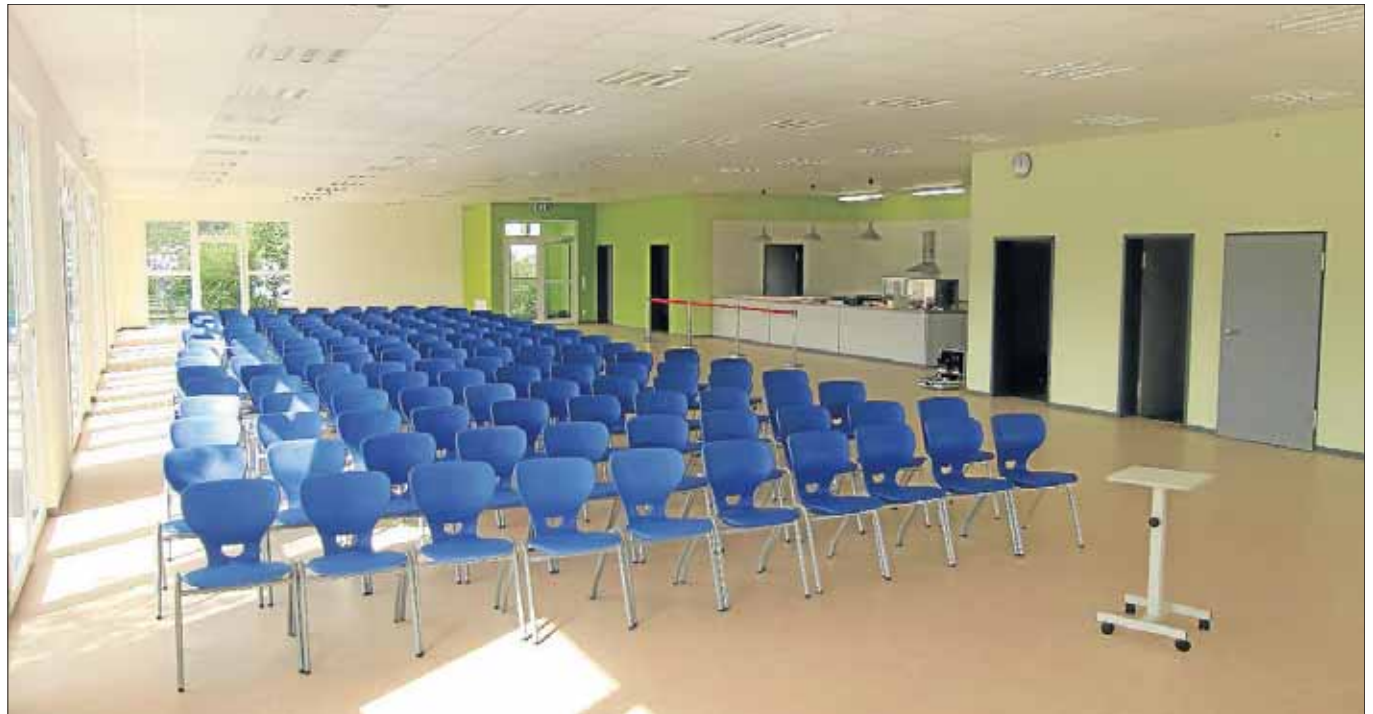
Hier lässt es sich lernen, arbeiten und essen: Die neue Mensa im Gymnasium bietet Platz für 160 Schüler.