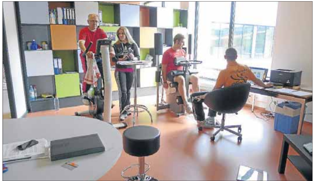
So geht Sport heute: Computergestützt und unter Anleitung qualifizierter Trainer bietet „Physio-Aktiv“ im Freizeitbad optimale Bedingungen für den persönlichen Erfolg.

Netphen. Am Samstag, 22. Oktober, von 9 bis 12 Uhr bietet das Bürgerbüro Netphen gemeinsam mit dem Kreis Siegen-Wittgenstein eine spezielle Führerschein-Umtauschaktion für die Netphener Bürger an. Der neue Führerschein kostet 24 Euro. Vorher muss aber noch an einiges gedacht werden: Mitzubringen sind nämlich für die Aktion der alte Führerschein, der Personalausweis, ein farbiges Lichtbild (35 x 45 mm) sowie eine Karteikartenabschrift der ausstellenden Behörde. Letzteres gilt aber nur dann, wenn der Führerschein nicht vom Kreis Siegen-Wittgenstein ausgestellt wurde.