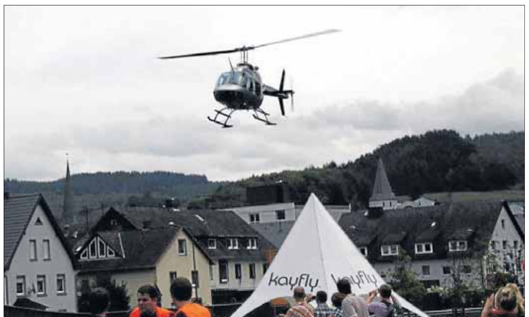
Eine echte Attraktion waren die Hubschrauber-Rundflüge mit „kayfly“ – allerdings nur solange das Wetter mitspielt.

Im großen Festzelt auf dem Rathausplatz herrschte mit Beginn des Frühschoppenkonzertes des Musikzugs der Freiwilligen Feuerwehr Netphen reger Andrang. Hier begeisterten auch die Kinder der Grundschulen Hainchen und Salchendorf, der Katholischen Kindergärten Walpersdorf und Brauersdorf und die Mädchen der Tanzgruppe Netphen mit ihren Darbietungen die Besucher. Die anschließende Kinderdisco fand regen Zuspruch, bevor Schlagersänger Tommy Stern die Veranstaltung mit einem Auftritt abrundete. Die Gewinner der insgesamt 76 Keilerfest-Quiz-Preise wurden ermittelt und schriftlich benachrichtigt. Die Stadt Netphen bedankt sich bei Netphen Events und allen Beteiligten, besonders den Sponsoren, die zum Gelingen des Keilerfestes beigetragen haben.