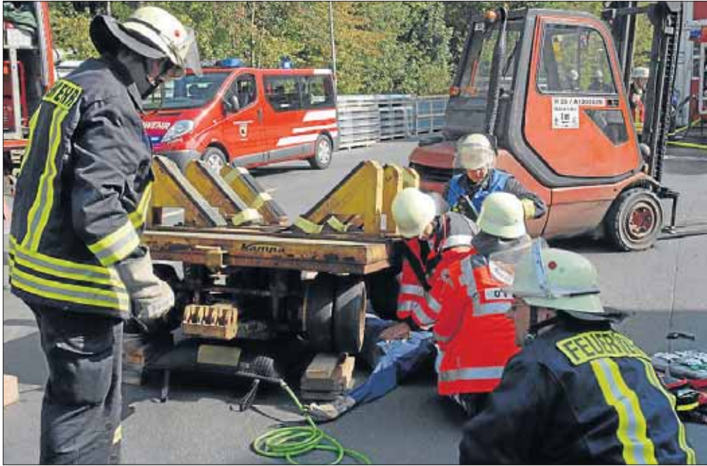
Die Löschgruppen des Oberen Netpher Siegtals mussten einen eingeklemmten Mitarbeiter der Firma Fischer Profile „retten“.

Einige der Mitarbeiter konnten noch schnell die Halle verlassen und sich in Sicherheit bringen. Während