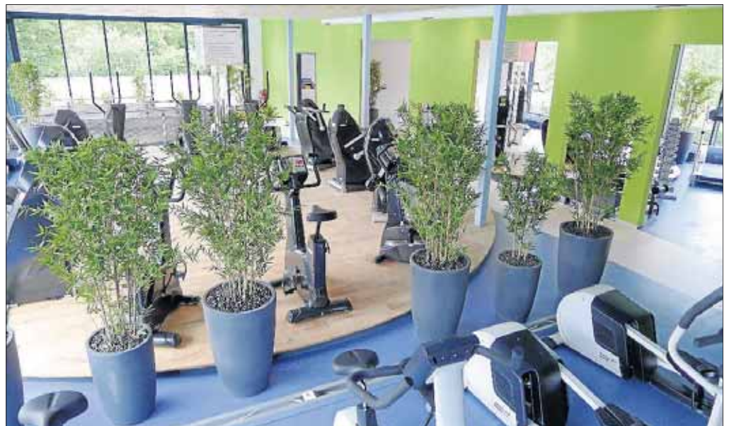
Hier macht Bewegung Spaß: Bei der Einrichtung der Trainingsräume wurde ein Ambiente geschaffen, in dem sich die Sportler wohl fühlen.

Die Verbindung mit dem Freizeitbad und der Saunalandschaft bietet die Möglichkeit, einen umfangreichen Sport- und Wellnessstag zu erleben. Gerade nach dem Sport bietet das Schwimmbad mit dem Thermalbecken und dem Dampfbad oder der Besuch der Saunalandschaft das richtige Kontrastprogramm zur nasskalten Jahreszeit.