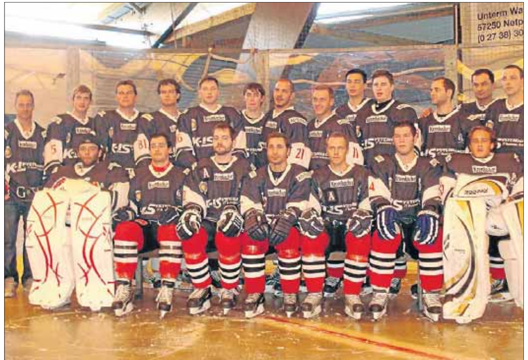
Trotz jeder Menge Eis: Die Spieler des Eishockey-Oberligisten EHC Netphen sind heiß auf die kommende Saison. Heute Abend gastieren die Frankfurt Lions im Sportpark.

Netphen. Papenburg und die Meyer-Werft waren die Ziele der Trimmabteilung des TVE Eckmannshausen. Bereits früh am Morgen ging es in Richtung Papenburg los. Den Teilnehmern stand ein volles Programm bevor; auf den Spuren der Vergangenheit führte die Besichtigung der Van-Velen-Anlage mit anschließendem urigem Mittagessen. Von dort ging es ein Stückchen in die große weite Welt, nämlich zur Meyer-Werft, die die Netphener mit sachkundiger Führung besichtigen konnten. Am nächsten Tag wurden die Gäste noch in die Geheimnisse der Orchideenzucht eingeführt und natürlich kam jeder mit einer Orchidee im Arm nach Hause.