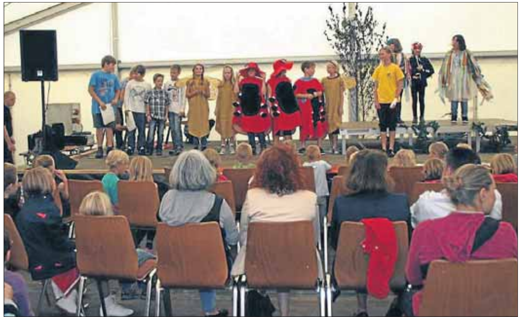
Ein buntes Programm boten die Kinder der Netphener Kindergärten unter anderem im großen Festzelt auf dem Rathausplatz.