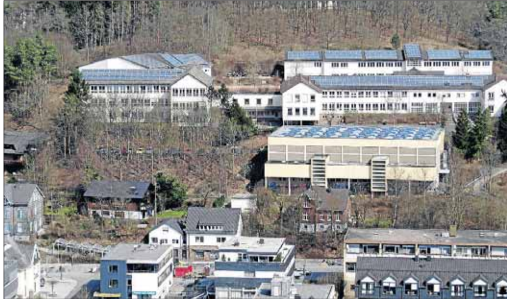
Die Realschule der Stadt Netphen mit der neuen Photovoltaikanlage ist nur eines von vielen spannenden Projekten des städtischen Immobilienservice.

Um 8 Uhr muss die Heizung wieder laufen, ansonsten haben die Kinder für heute schulfrei. Den Kindern würde das sicherlich gut gefallen, dem Bürgermeister gar nicht. Arbeitsalltag im Immobilienservice. Aber nicht nur die Schulgebäude werden „gemanagt“: Braucht jemand ein Baugrundstück oder ist an einer städtischen Immobilie interessiert? Hat ein Bürger Fragen zum ÖPNV oder zum Bürgerbus, möchte jemand als Landwirt städtisches Weideland pachten oder als Brenn-