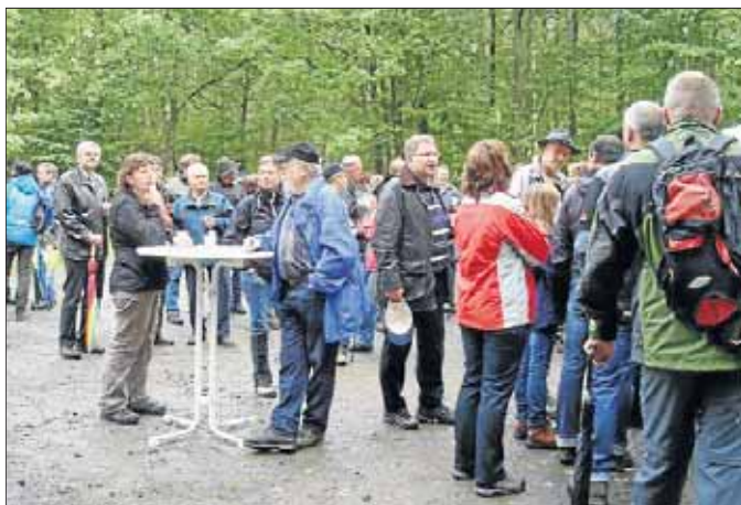
Anlässlich der gemeinsamen Jubiläen veranstalteten Grissenbach, Nenkersdorf und Salchendorf jetzt eine Sternwanderung zum „Hasenbahnhof“.

nötigen Pop-Appeal die bitter-süße musikalische Färbung. Textlich wimmelt es von Herzschmerz und Verlust – und doch ist stets ein Ausdruck zu finden, der Entschlossenheit und Lebensfreude ausdrückt. Am Freitag, 14. Oktober, 20 Uhr, spielen beide im Alten Feuerwehrhaus Netphen. Eintrittspreis: VVK 16 Euro, AK 18 Euro.