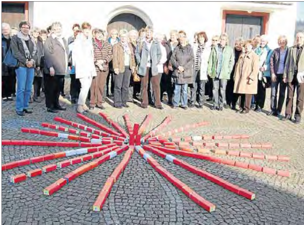
Eine strahlende Sonne aus Hunderten Salzpäckchen: Die kfd-Vorstände beteiligten sich an der symbolträchtigen Salz-Aktion des kfd-Dekanats Siegen.