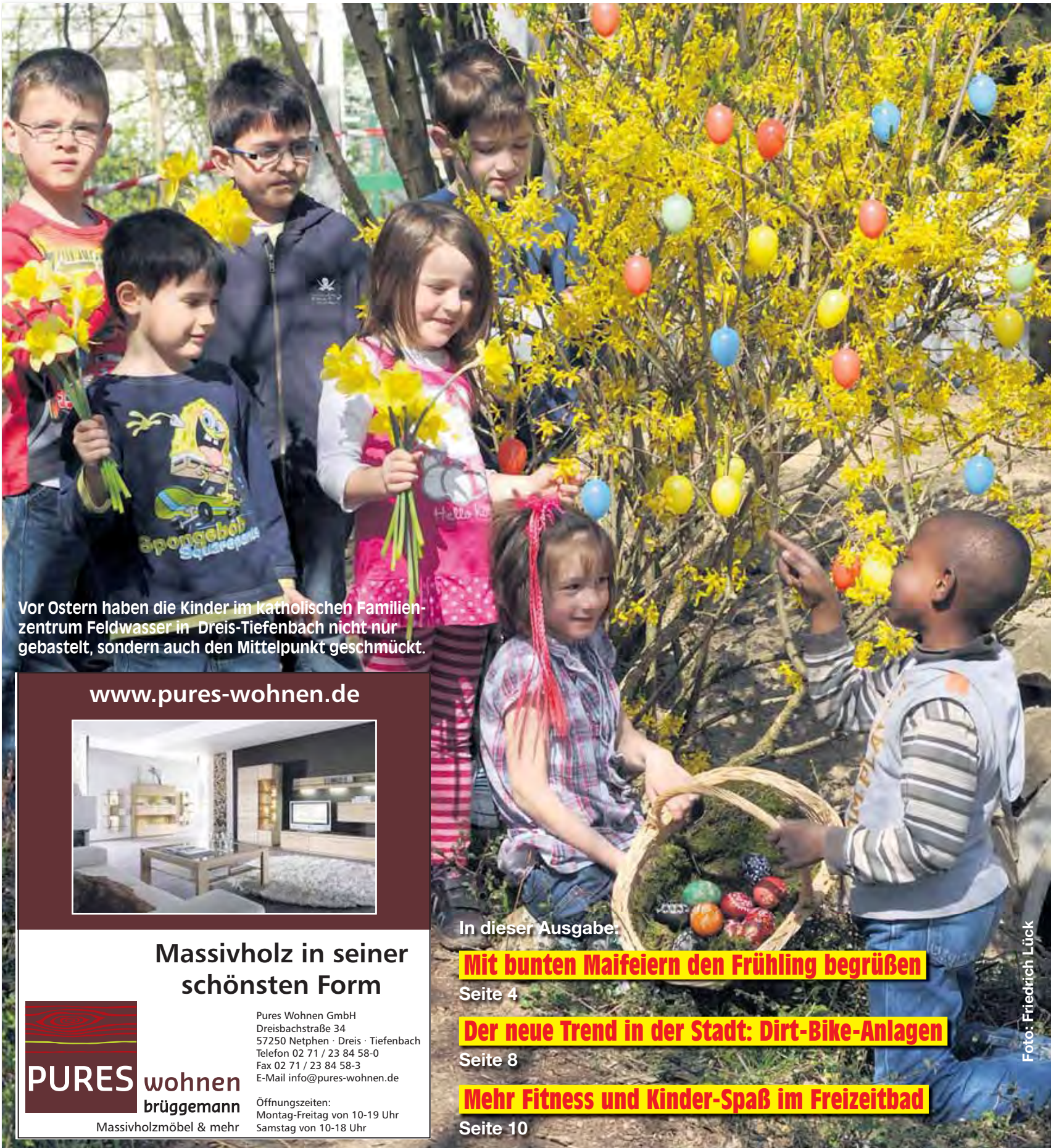
Vor Ostern haben die Kinder im katholischen Familienzentrum Feldwasser in Dreis-Tiefenbach nicht nur gebastelt, sondern auch den Mittelpunkt geschmückt.

Aktuelle Informationen und Angebote aus der Keiler-Kommune