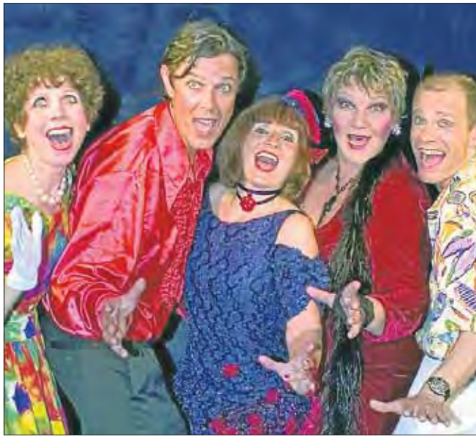
Einen farbenfrohen Abend versprechen „Ferrari Küsschen“.