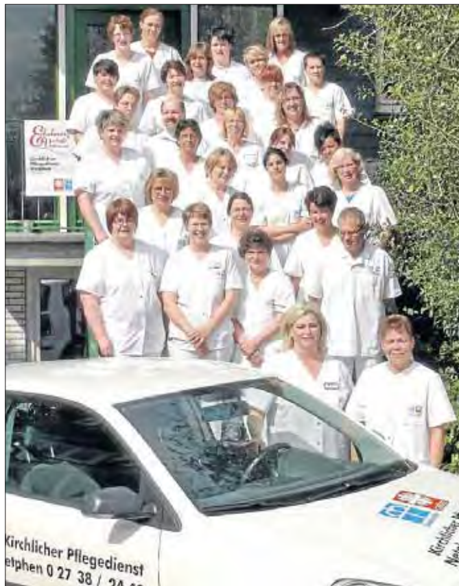
Ein starkes Team, das viele Pflegebereiche abdeckt.

hin zu Versorgung Schwerstkranker (Palliativpflege) wird angeboten. In den 30 Jahren ist der Pflegedienst um ein vielfaches gewachsen. Daher war zum 30. Geburtstag ein Umzug in erweiterte Büroräume fällig – am alten Marktplatz in Netphen genau zwischen den beiden Kirchen. Alle Interessierten sind schon jetzt eingeladen zu einer Vorstellung des Pflegedienstes in den neuen Räumen am Sonntag, 15. Mai, von 11 bis 13 Uhr (Marktplatz 2a).