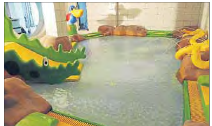
Das neue Planschbecken ist nach den Ferien betriebsbereit.

Ergänzt wird das Angebot mit zahlreichen Ausdauergeräten im Cardibereich. Die persönliche Betreuung durch Physiotherapeuten ermöglicht auch ein Funktionstraining, das auf die speziellen Bedürfnisse abgestimmt ist. Den Nutzern des Fitnessbereiches steht das Schwimmbad mit Thermalbecken und Dampfbad kostenfrei zu Verfügung. Auf Wunsch kann man die Saunalandschaft mit drei Saunen, einem Dampfbad und verschiedenen Ruhebereichen dazu buchen.