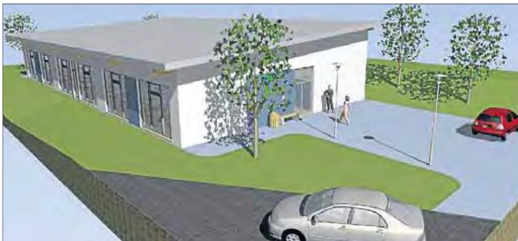
Nach neuesten Gesichtspunkten wurde der Bau entworfen.