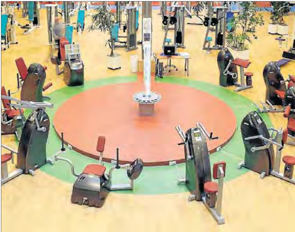
Der Physiotherapie- und Fitnessbereich öffnet Mitte Mai. Dort wird unter anderem ein computergestütztes Gerätetraining angeboten.