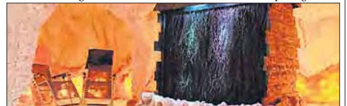
Hier kann man mal richtig durchatmen und sich entspannen.