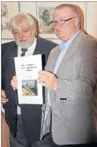
Das Sonderheft ist fertig.

Netphen. Sein 40-jähriges Bestehen hat der Heimatverein Netpherland zunächst intern mit einem Geschichts-Kaffeeklatsch im Heimatmuseum gefeiert. Dazu wurden Mappen mit interessanten Bildern und Dokumenten aus je zehn Jahren rumgereicht.