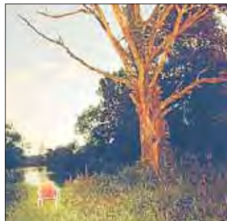
Das ist Hütters Märchenwelt

sich der Symbolik der Märchen und beraubt sie zugleich ihrer Klarheit.