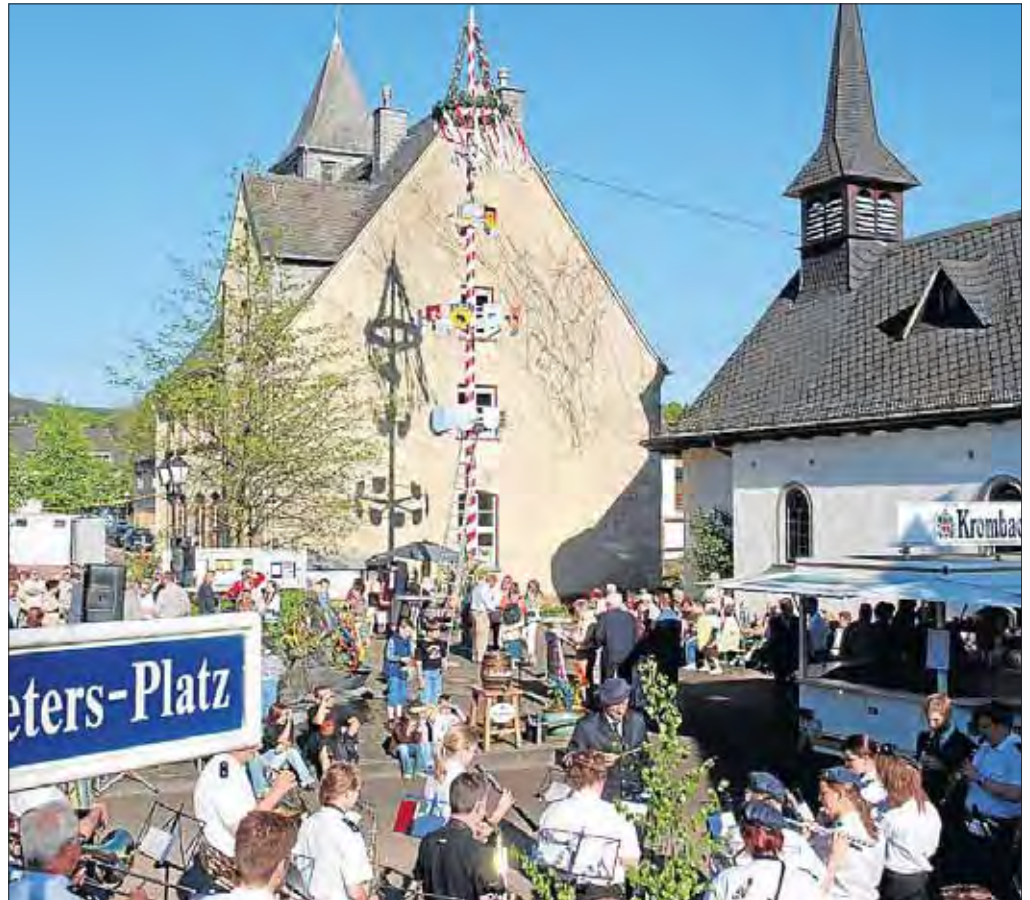
So zünftig geht es jetzt wieder auf vielen Plätzen zu. Jeder kann mitfeiern.