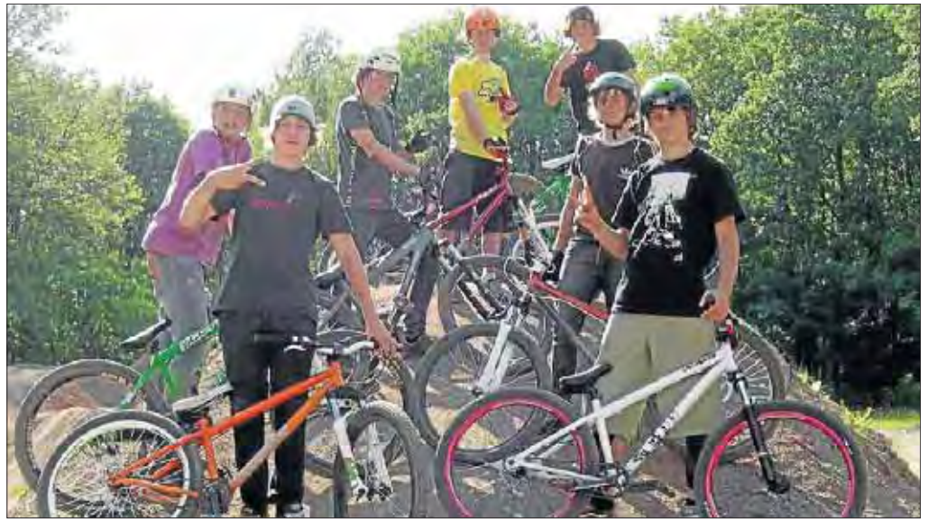
Die Rampe ist ihr Zuhause: Die Dirt Bike Crew aus Netphen wirbelt gerne Staub auf.