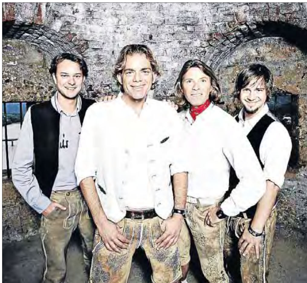
Sorgen wieder einmal für beste Stimmung im Festzelt: die „Trenkwalder“ aus Tirol.