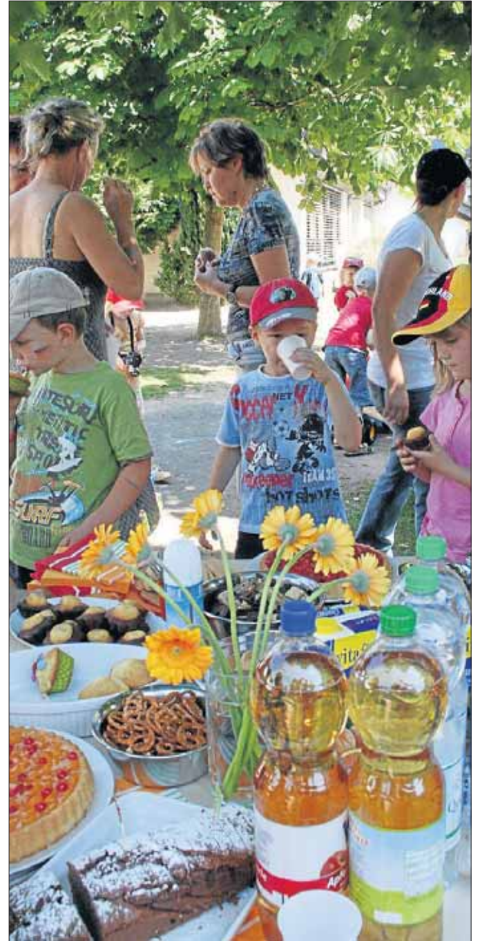
Zwischendurch konnten sich die Kleinen reichlich stärken.