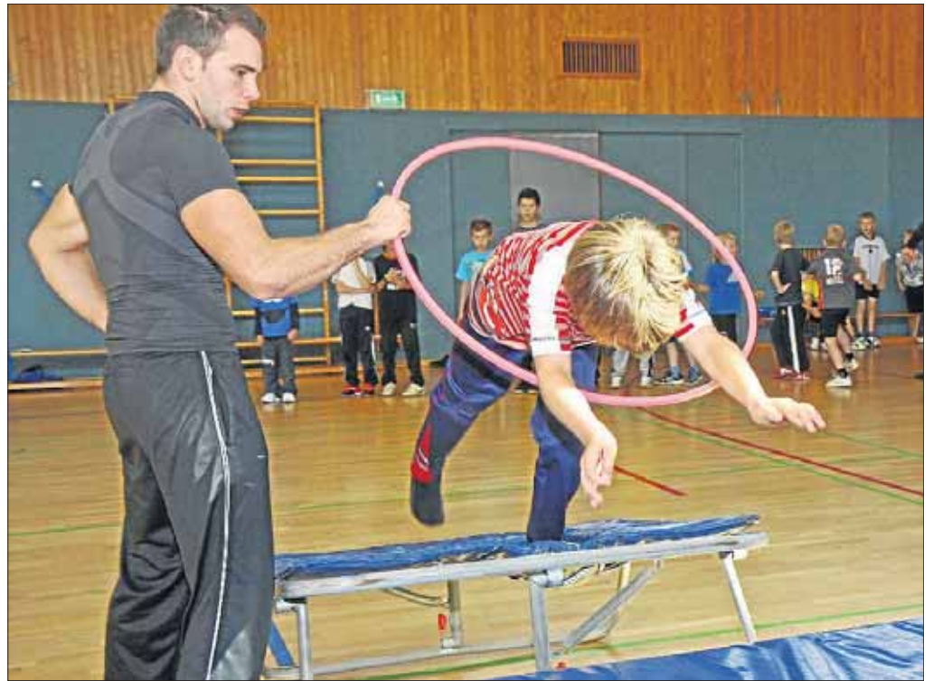
Ab durch die Mitte: Mutig strzten die sich Nachwuchs-Akrobaten ins Training.