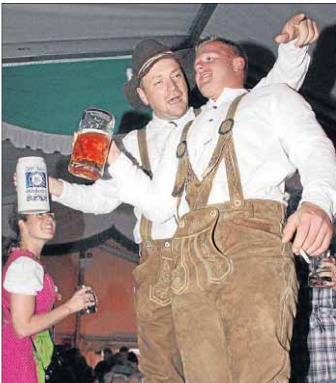
Es ging über Tische und Bänke...