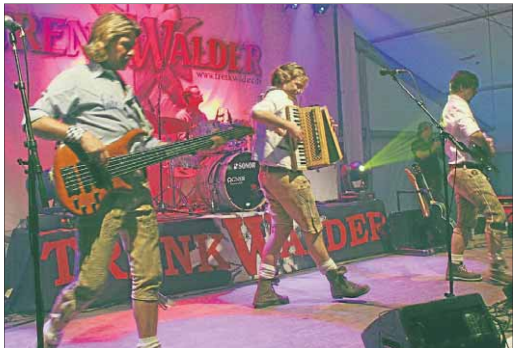
Wer sagt denn, dass Volksmusik immer beschaulich daher kommt.