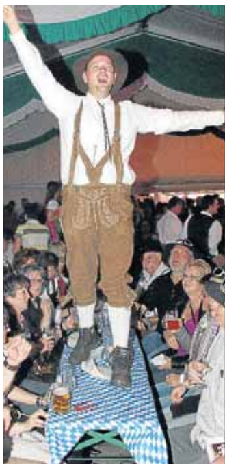
Nur nicht nach unten sehen.