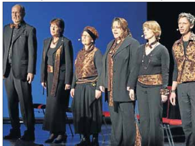
„Ich habe einen Traum“ – Die Ideen von Martin Luther King.