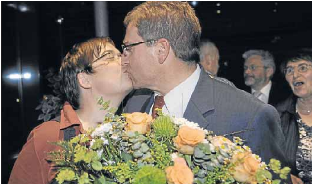
Der Kuss des Siegers: Direkt nach dem Vergnügen begann die Arbeit des Bürgermeisters.