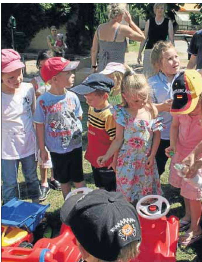
Das neue Spielzeug war natürlich dicht umlagert.

und Saft natürlich nicht fehlen. Eine kleine süße Kindergarten-Tüte gab es ebenfalls für die Neuankömmlinge. Der Förderverein des Kindergartens St. Antonius Netphen freut sich zudem über weitere Mitglieder. Weitere Informationen zur Arbeit gibt es unter ☎ 02738/1282.