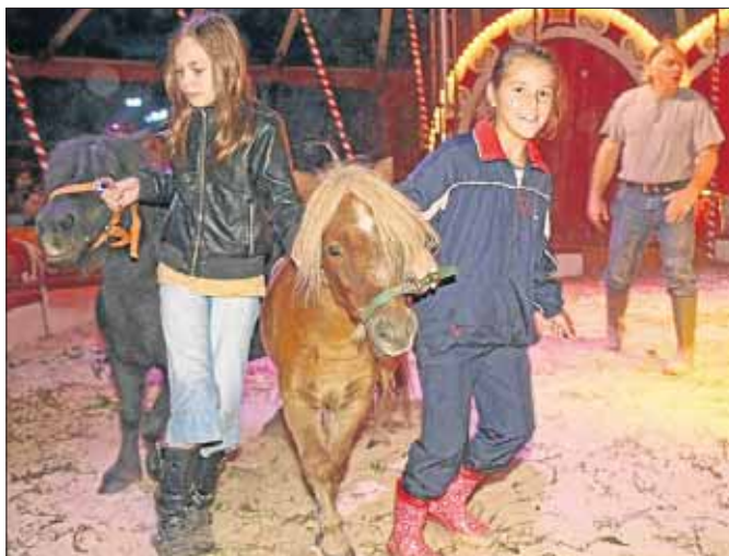
Mit dem Pony durch die Manege – ein echter Kindertraum.

Nach einigen Trainingstagen konnten die Kids in einer Generalprobe dann erstmalig vor Publikum und in Kostmen ihr Knnen und Beweisen stellen. Zum Abschluss ernteten die kleinen Knstler bei der Galavorstellung tosenden Applaus im prall gefllten Zirkuszelt.