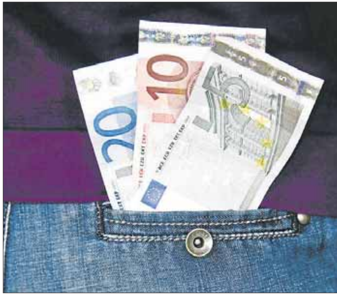
Generationsübergreifend Erfahrungen sammeln und Taschengeld verdienen.

Mit diesem Angebot sollen den Senioren nicht nur Hilfen im Alltag angeboten werden, vielmehr soll hiermit ein Zu-