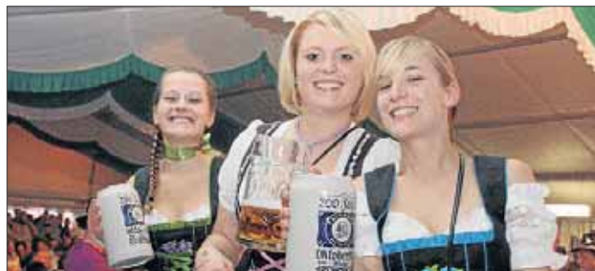
Bei so einer Fete sollte Bier nur in Maßen genossen werden.

Netphen. So feiert das Netpherland: Beim Oktoberfest wurde geschunkelt, was der Keiler hergab. Hinter der legendären Münchner Wiesn' musste man sich hier ein ganzes Wochenende lang bestimmt nicht verstecken. Groß und Klein feierten eine Riesen-Sause und verlegten den Weißwurst-Äquator kurzfristig einige Kilometer Richtung Norden. Eine ganze Galerie mit Oktoberfest-Bildern gibt's im Internet unter www.siegerlandkurier.de .