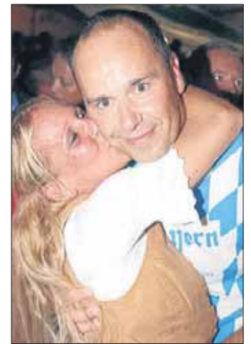
Der andere Glücksstifter.