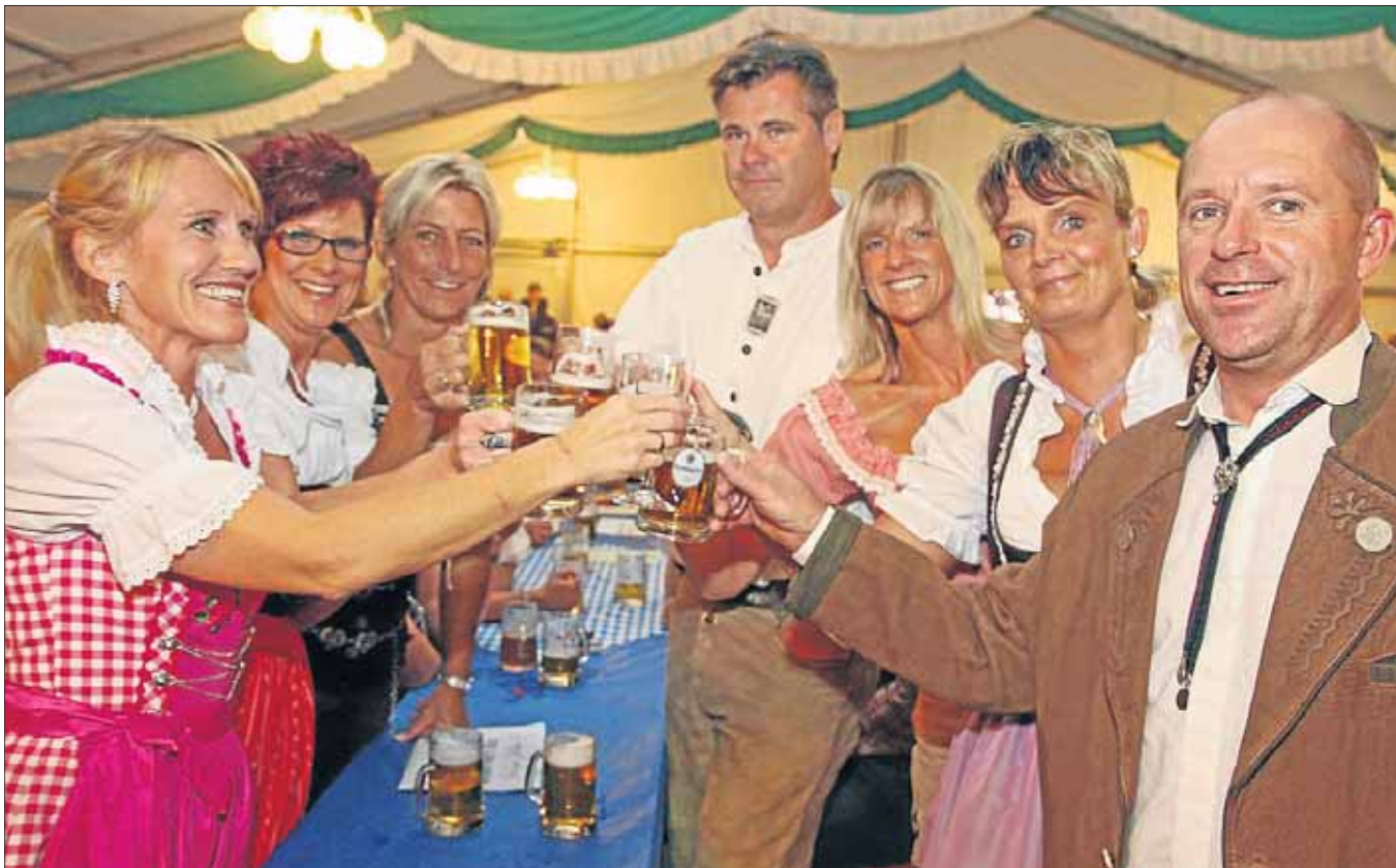
Ein Prosit der Gemütlichkeit: Auf der Münchener Theresienwiese kann's auch nicht zünftiger sein.