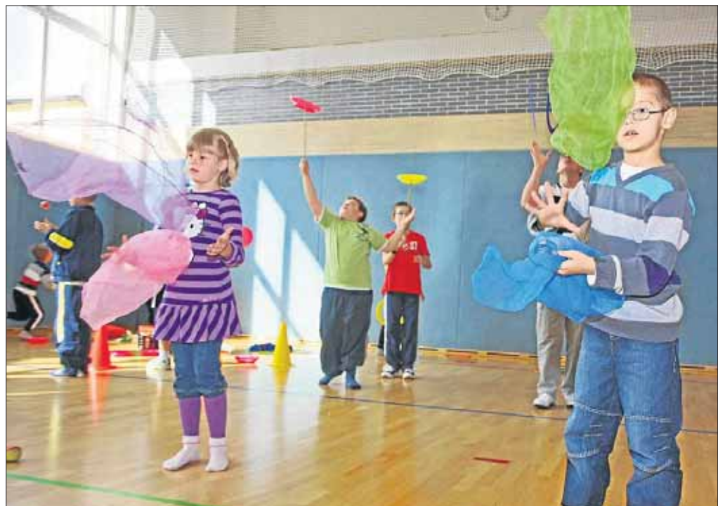
Bei der Jonglage zhlt ein ruhiges Hndchen – besser sind allerdings gleich zwei.