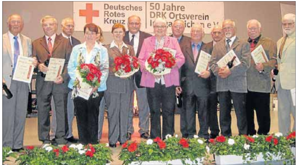
Die Gründungsmitglieder des DRK-Zugs Irmgarteichen. Vor 50 Jahren bildeten sie die jüngste Gruppe im Kreisverband.