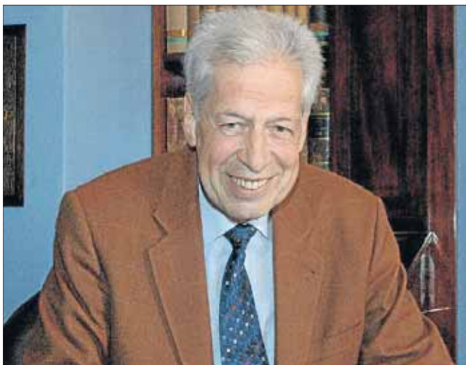
Muntert auf zu neuen Perspektiven: Autor Henning Scherf.

„Nun mal los, kümmert euch!“, lautet sein deutlicher Appell an die Mit-Senioren: „Guckt, wo ihr gebraucht werdet. Wir sind ein Geschenk für die Gesellschaft“, sagt der Autor.