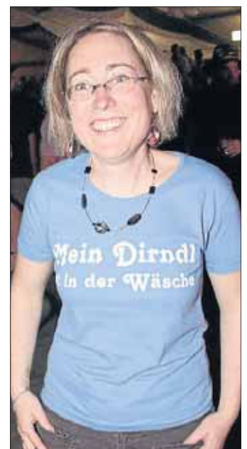
Ach, schade. Dann halt nicht.