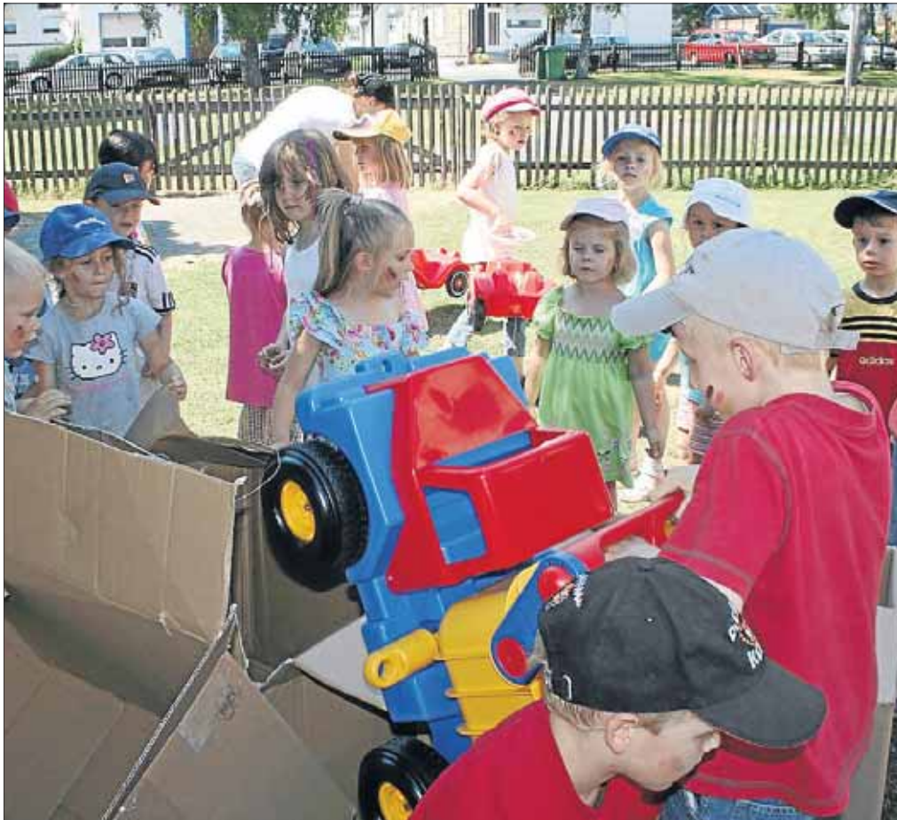
Was da wohl drin sein mag? Bei dieser Ungewissheit hilft nur eins: auspacken.