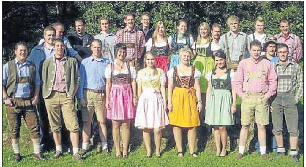
Gruppenbild in zünftig-bajuwarischer Tracht: pure Lebensfreude verbindet nunmal.

Elektroinstallation Netzwerktechnik Solar- u. Photovoltaikanlagen mobil 0170/7339063 E-Mail: info@stoetzel-elektrotechnik.de