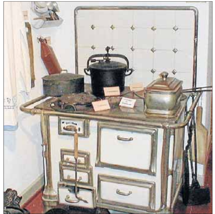
Als man noch am Herd brutzelte: Ein echtes Liebhaberstück.

So müssen die Angehörigen zunächst auf eigenes finanzielles Risiko den Pflegedienst beauftragen und die Zeit der Ungewissheit überstehen, ob die beantragte Pflegestufe mit den damit verbundenen finanziellen Zuschüssen auch genehmigt werde. Wer in einer solchen Situation nichts auf der hohen Kante habe, könne in große Schwierigkeiten geraten. Hier sah Jutta Werthebach vom KAB-Vorstand Bedarf, sich dem Problem anzunehmen und initiativ zu werden, um Schieflagen zu minimieren.