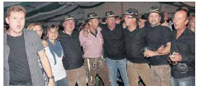
Zusammen singt man lauter, wenn auch nicht schöner.