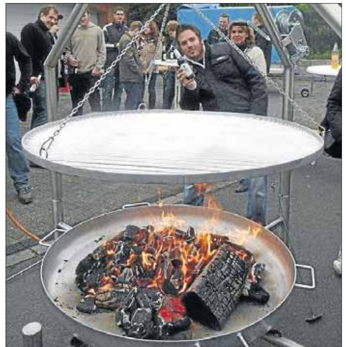
Spezialanfertigung: Echte Fleischfreunde sind hier am Werk.

Regelmäßige Feiern, Grillabende und Ausflüge sind fester Bestandteil des Vereinsle-