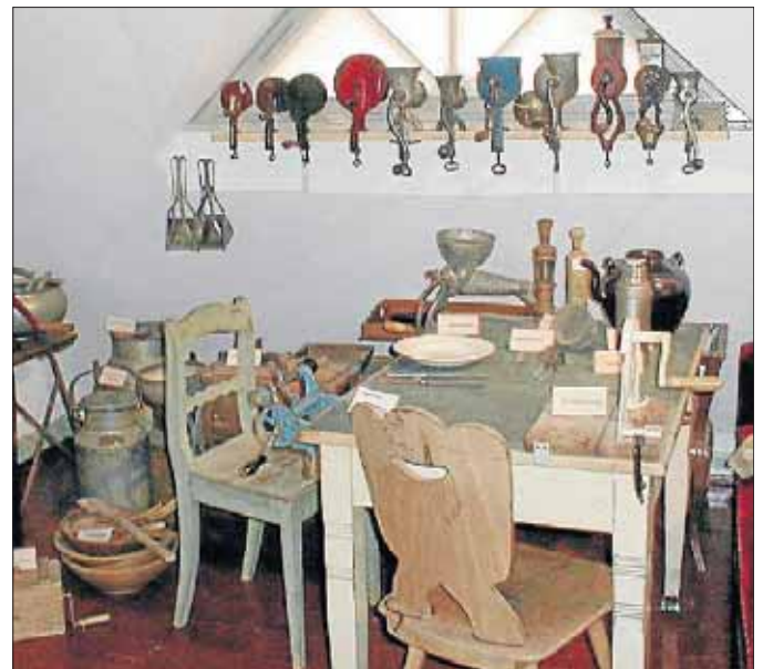
Viele Ausstellungstücke sind heute kaum noch zu finden.

Alle Exponate werden den Besuchern auf Wunsch erklärt. Die Heimatstube ist jeden ersten Sonntag im Monat von 14 bis 17 Uhr geöffnet.