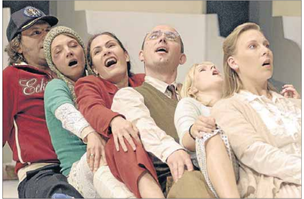
Theater „Wie im Himmel“ – nach einem schwedischen Kultfilm von Kay Pollak.