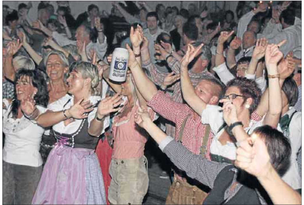
Ein Prosit der Gemütlichkeit: Hier bleibt man nicht lange alleine.