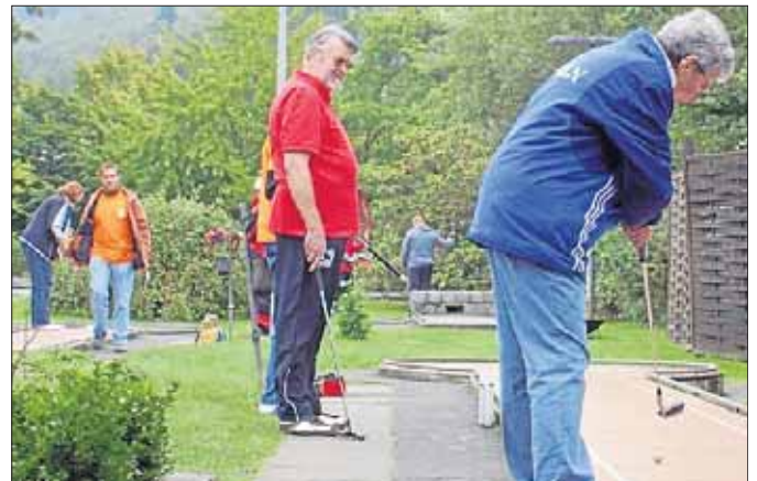
Nur die Ruhe: Netphener Minigolf-Cracks beim Einlochen.

Die Bauarbeiten kosten 530.000 Euro und beginnen voraussichtlich 2012. Nach Abzug von Fördermitteln müsste die Stadt Netphen noch etwa 300.000 Euro selbst zahlen.