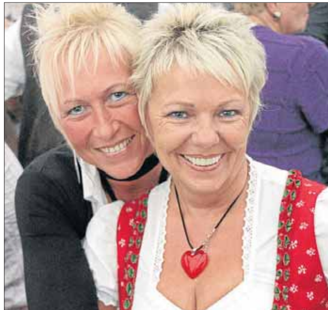
So jung kommen wir nicht mehr zusammen.